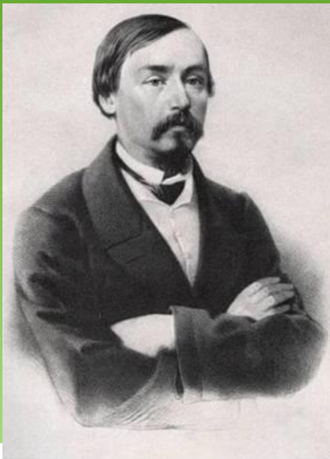
Н.А. Некрасов. 1840 - 1850 годы

В 1840-1850-е годы активно сотрудничает с самыми крупными литературными журналами XIX века - «Отечественные записки» и «Современник».