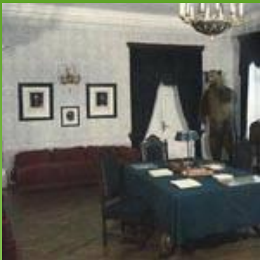
Приемная редакции «Современника»