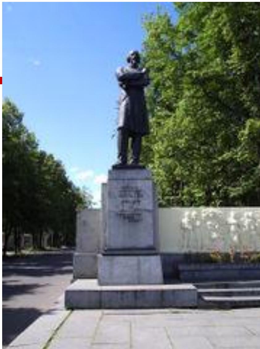
Памятник Некрасову в Ярославле .