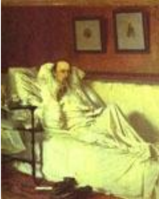
Портрет: Некрасов Н. А., Крамской 1877г.