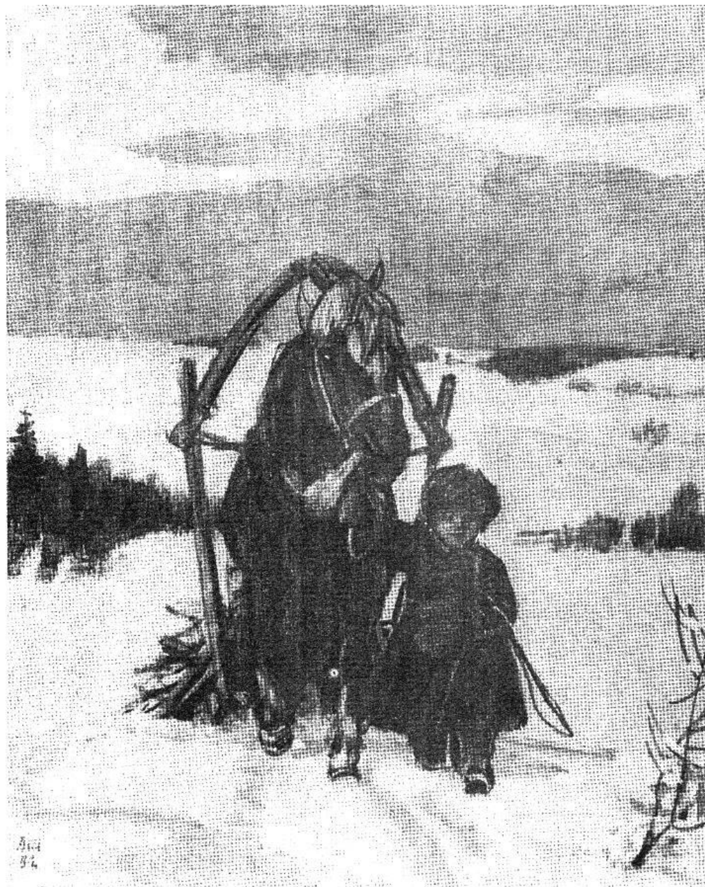
«Мужичок с ноготок» Художник Д.А. Шмаринов