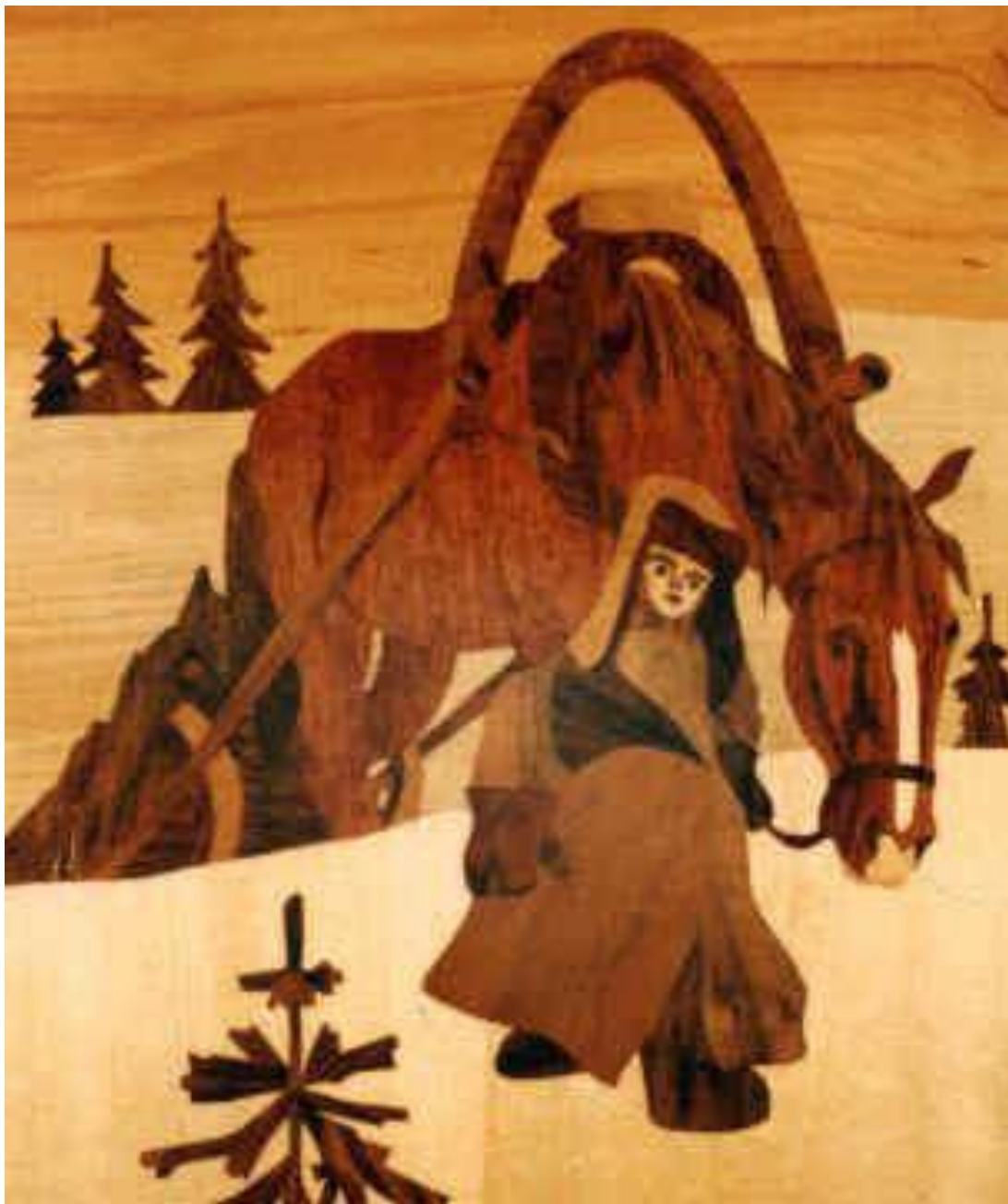
«Мужичок с ноготок» Художник И. Зиновьев