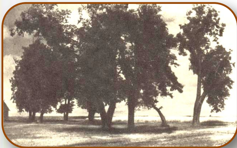
Любимое место матери Некрасова