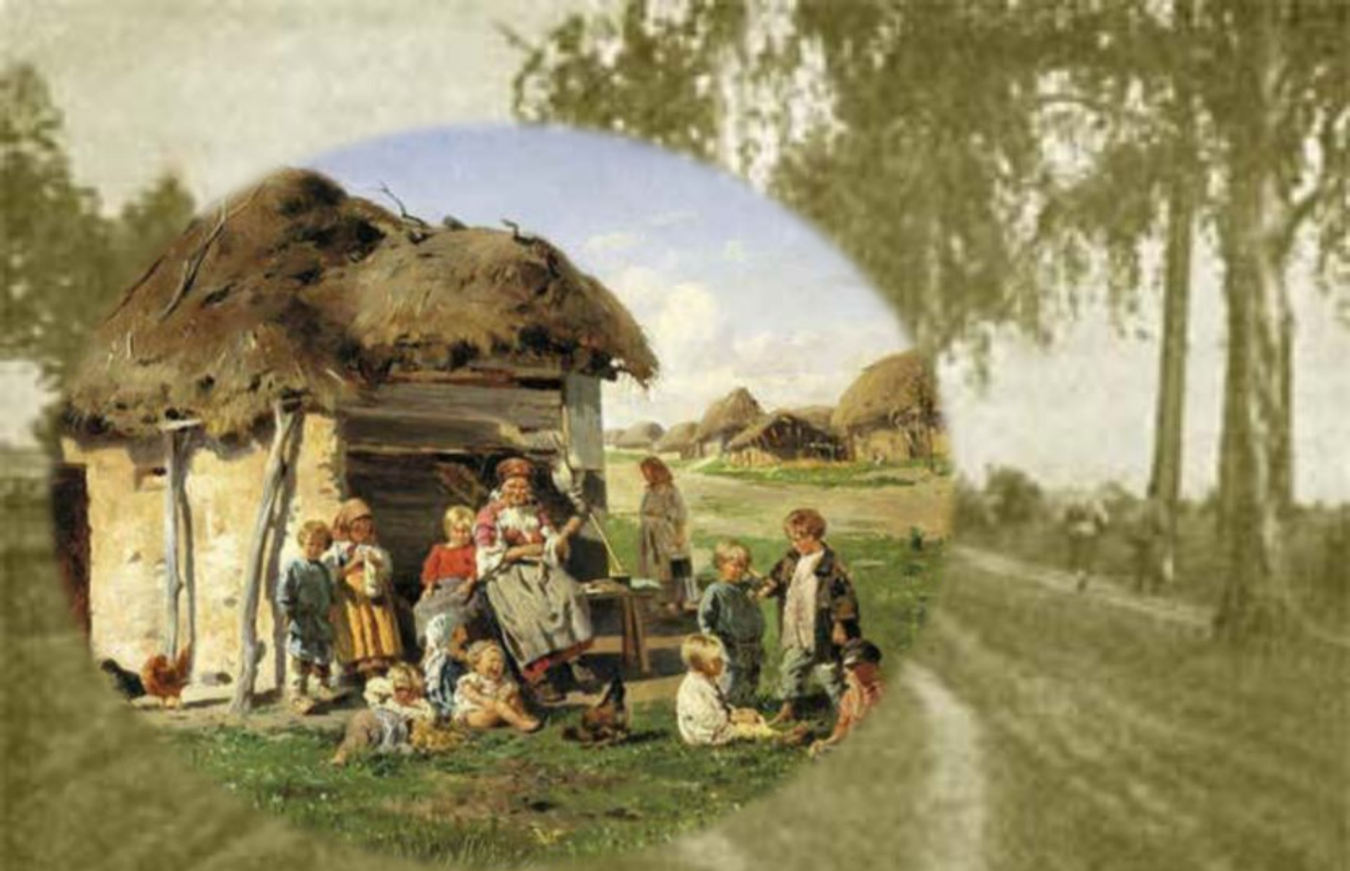
В.Маковский. Крестьянские дети