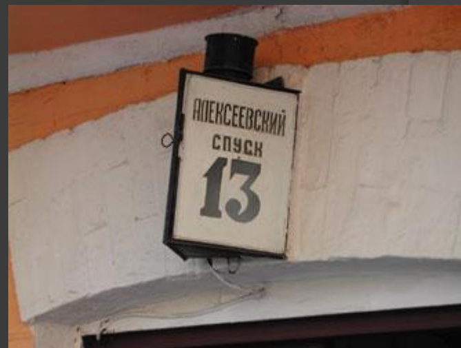
Этот номер - самый важный номер на Андреевском спуске!