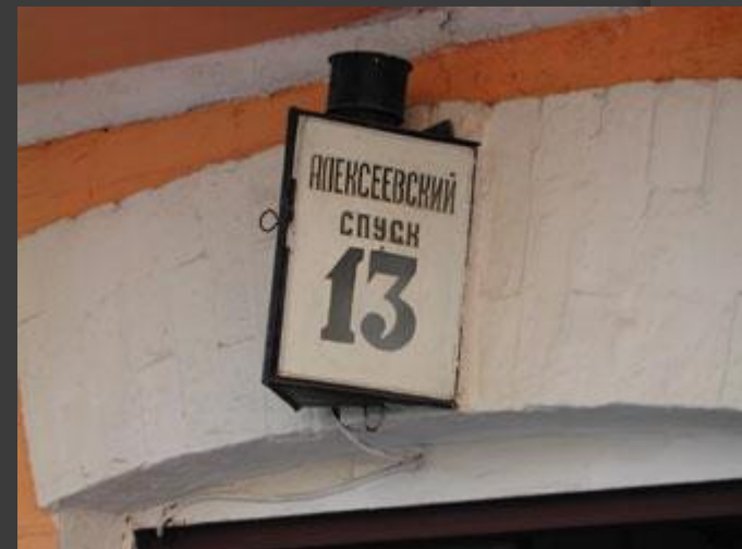
Этот номер - самый важный номер на Андреевском спуске!