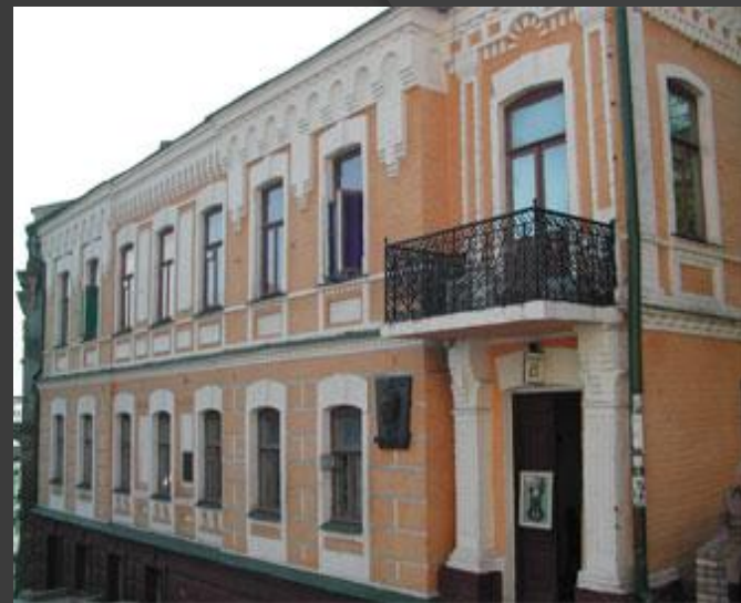
А вот и сам дом-музей М. А. Булгакова. Этот дом занимала с 1906 по 1919 гг. семья Булгаковых. Здесь же жили и Турбины.

После выздоровления Булгаков оставил медицину и начал сотрудничать с газетами. «Грядущие перспективы» – так называется одна из его первых публицистических статей. Первые драматургические опыты появились во Владикавказе: одноактная юмореска «Самооборона», «Парижские коммунары», драма «Братья Турбины» и «Сыновья муллы».