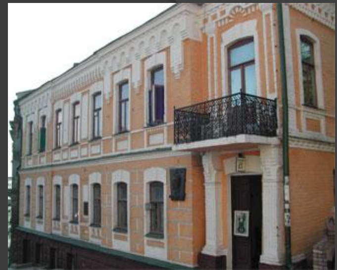
А вот и сам дом-музей М. А. Булгакова. Этот дом занимала с 1906 по 1919 гг. семья Булгаковых. Здесь же жили и Турбины.

После выздоровления Булгаков оставил медицину и начал сотрудничать с газетами. «Грядущие перспективы» – так называется одна из его первых публицистических статей. Первые драматургические опыты появились во Владикавказе: одноактная юмореска «Самооборона», «Парижские коммунары», драма «Братья Турбины» и «Сыновья муллы».