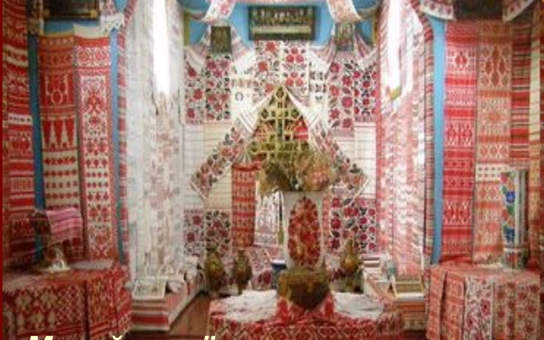
Музей українського рушника в козацькій церкві, м. Переяслав- Хмельницький.