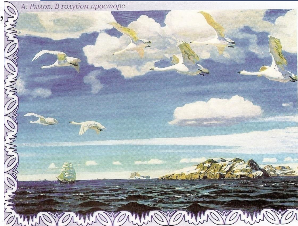
А. Рылов. В голубом просторе