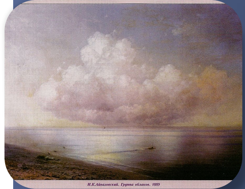
И.К. Айвазовский. Группа облаков. 1889