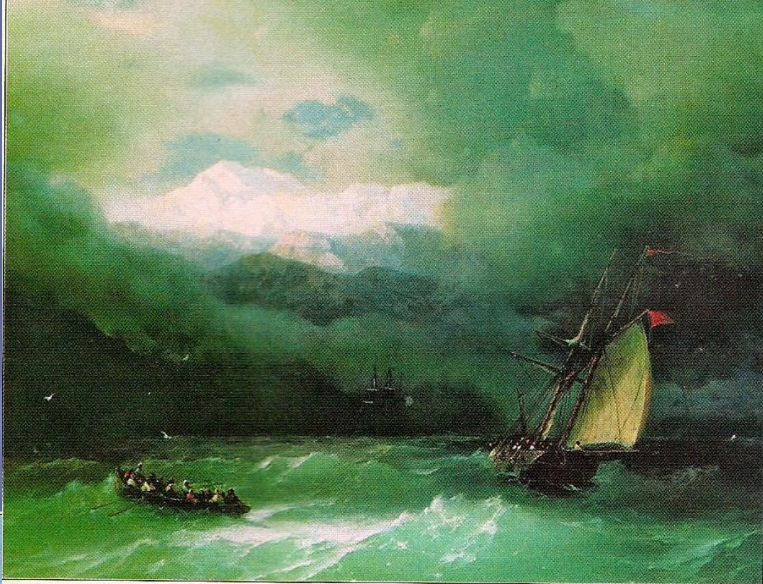
И.К.Айвазовский. Бурное море. 1868