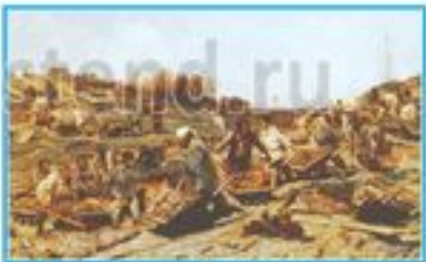
Ремонтные работы на железной дороге. Художник К. Самойлов

Да не робей за отчислу лобезную... Вынес достаточно русский народ, Вынес и эту дорогу железную – Вынесет все, что господь ни пошлет!