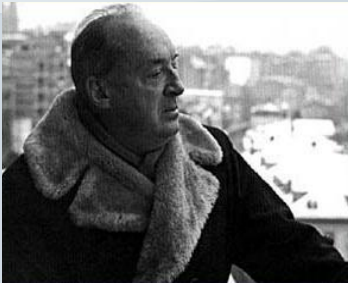
Владимир Владимирович Набоков (1899-1977 гг)

«Я не выношу копания в драгоценных биографиях великих писателей.., и ни один биограф даже Краем глаза не посмеет заглянуть в мою личную жизнь»