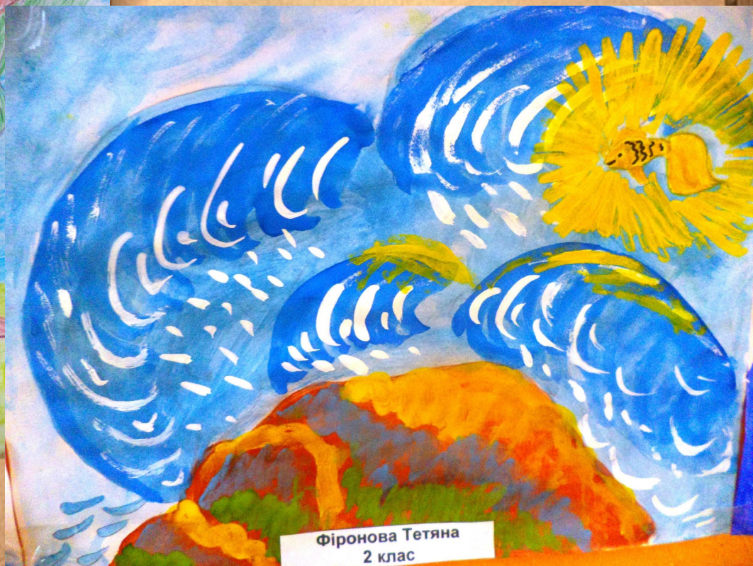
Фіронова Тетяна 2 клас