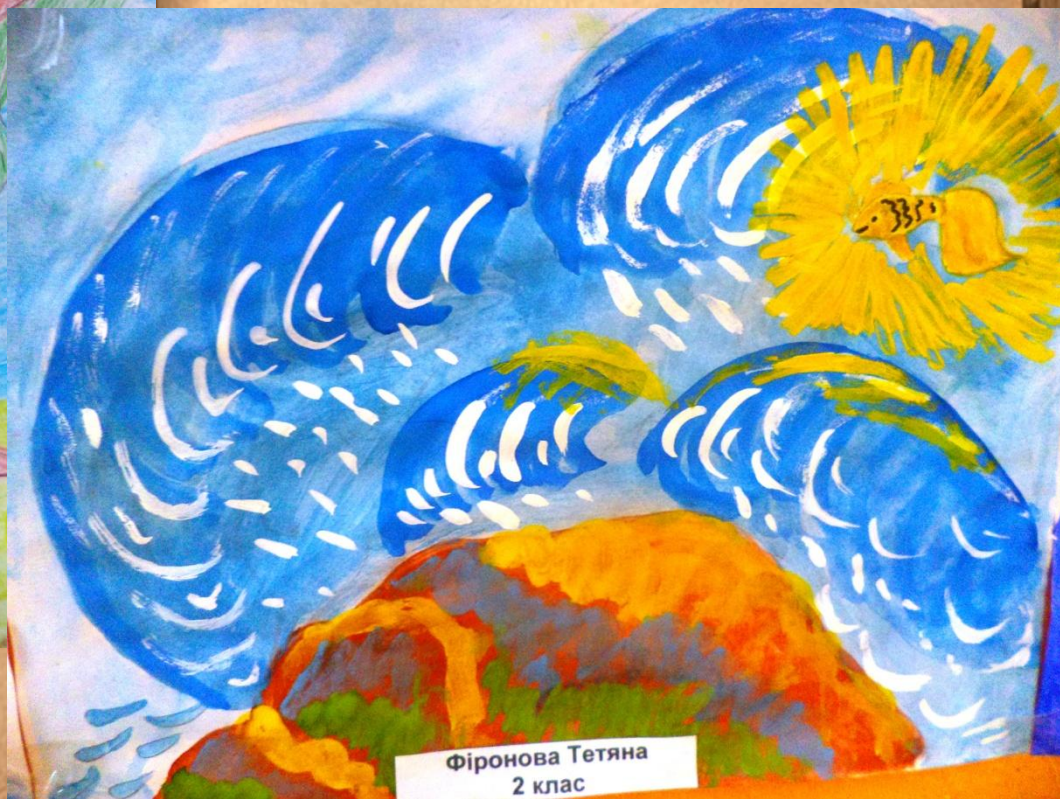
Фіронова Тетяна 2 клас