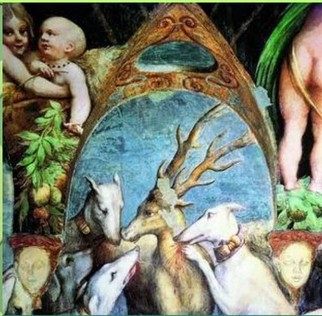
(Актеон, терзаемый собаками.)