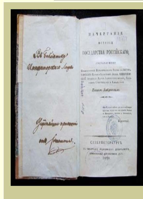
Кайданов И. К. Начертание истории государства Российского.

Пушкин и его товарищи по первому выпуску сохранили о своем учителе истории добрые воспоминания.