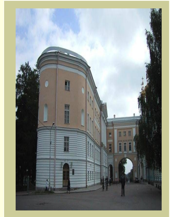
Царскосельский лицей, современная фотография

Именно в Лицеи из мальчишки Пушкин превратился в поэта, имя которого стало известно за пределами Царского Села. А заслуга в этом наставников поэта.