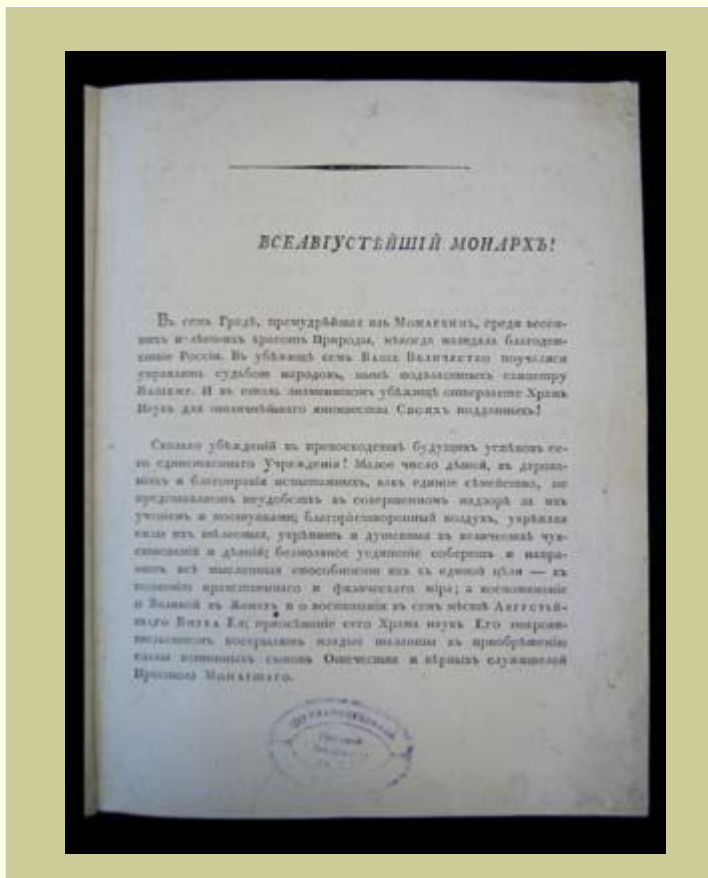
Речь директора Лицея В.Ф. Малиновского

В.Ф. Малиновский перевел несколько книг Библии, выпускал периодическое издание «Осенние вечера».