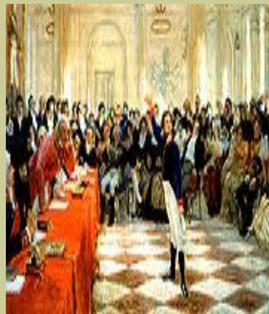
Экзамен в Лицеи

Заслужить подобную оценку у Будри было не так – то просто!