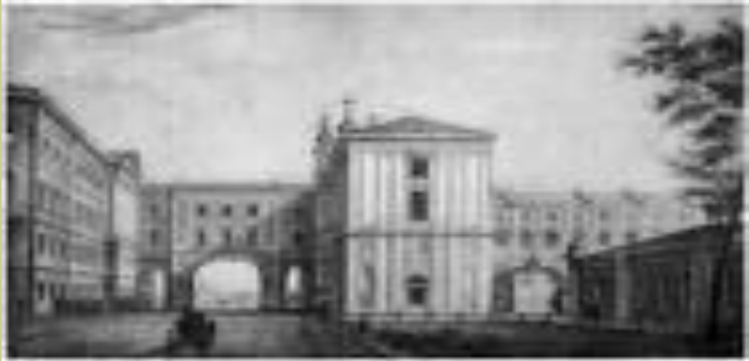
Царскосельский Лицей на рисунке XIX века