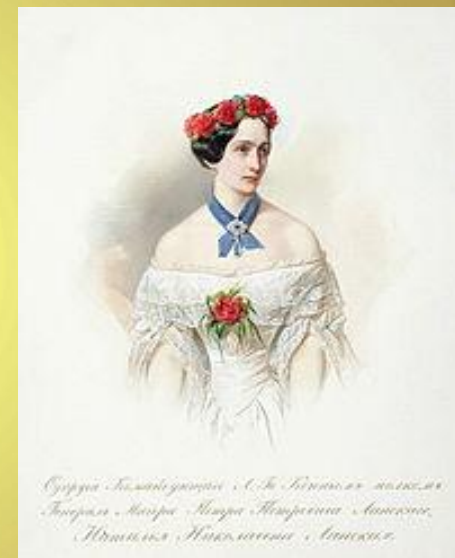
Супруга Александровича, А. С. Пушкина, Наталья Николаевна, Александра Николаевна, Мария Александровна, Александровна, Наталья Александровна, Ланские.