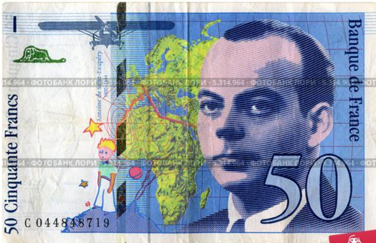
Банкнота Франции, 50 франков 1997 г. Портрет писателя Антуана де Сент