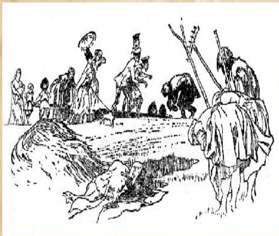
И. Годин. Иллюстрация к поэме Н.А. Некрасова «Кому на Руси жить хорошо».

В поэме «Кому на Руси жить хорошо» Н.А. Некрасов изобразил жизнь народа в один из самых сложных моментов истории.