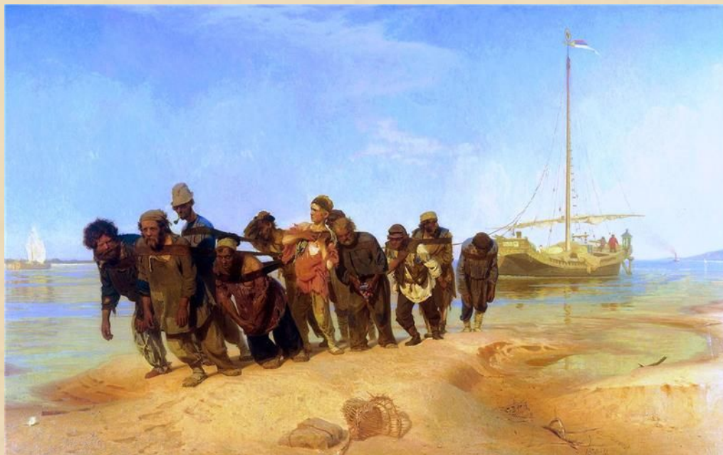
Репин. Бурлаки на Волге