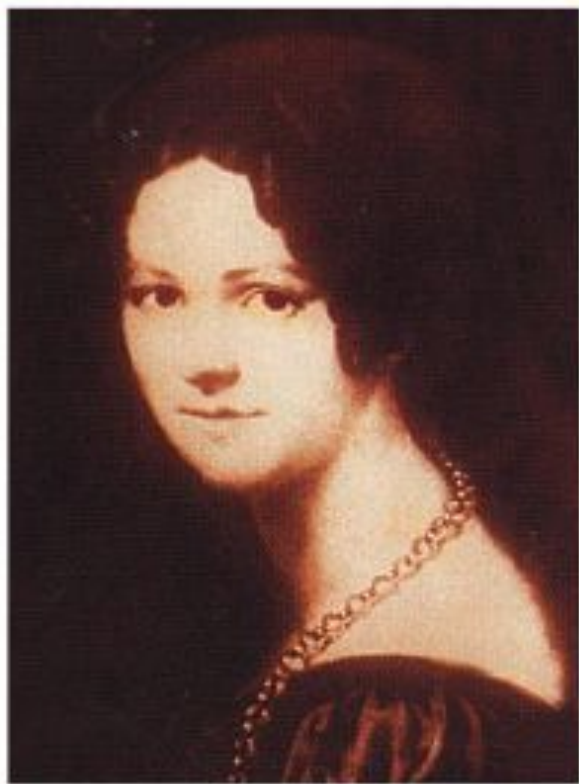
Екатерина Ивановна Трубецкая

Имя героини - в заглавии I части поэмы, указание подзаголовка — 1826 г. — поэт восхищается поступком этой женщины, она первая добилась разрешения поехать к мужу в Сибирь.