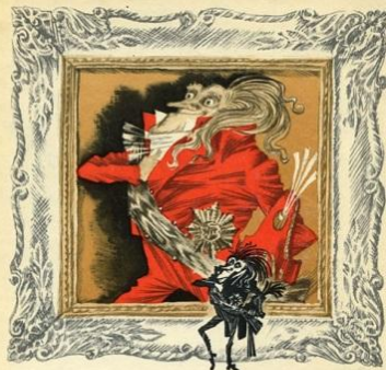
ЭРНСТ ТЕОДОР АМАДЕЙ ГОФМАН МАЛЕНЬКИЙ ЦАХЕС, ПО ПРОЗВАНИЮ ЦИННОБЕР