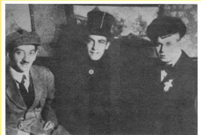
41. С.А.Есенин, А.Б.Мариенгоф, Г.Б.Якулов. 1919.