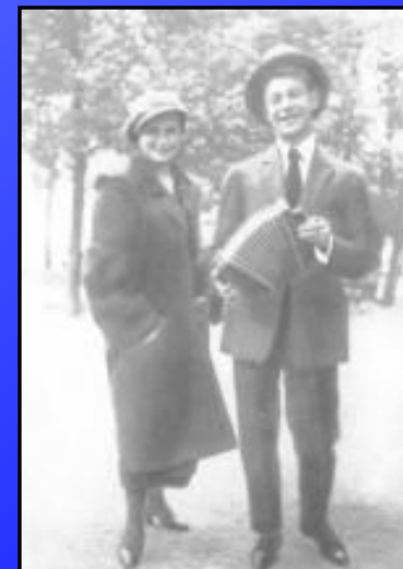
Есенин с сестрой