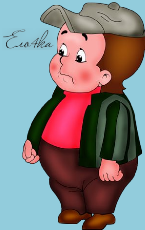
Стекляшкин и Пончик