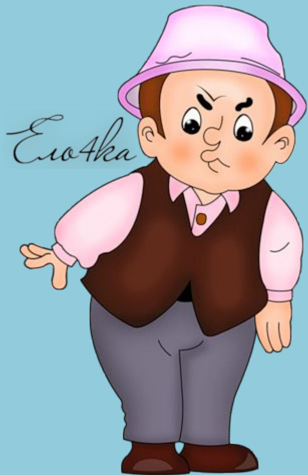
Знайка и Ворчун