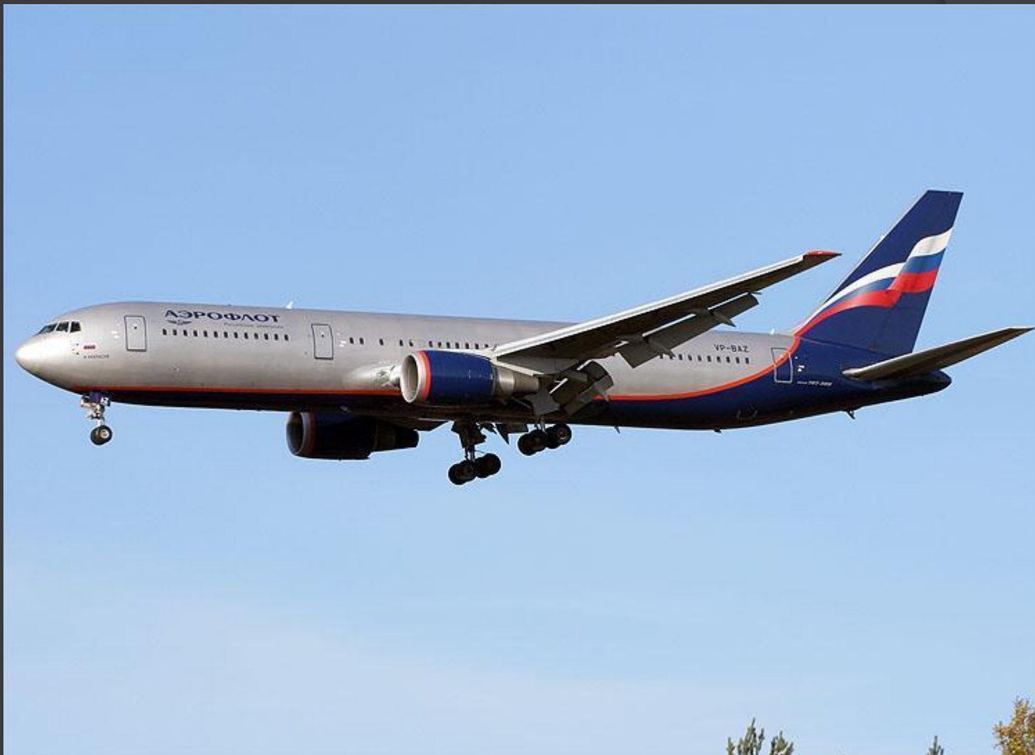
«Николай Некрасов» Boeing 767