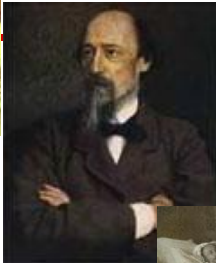
Некрасов Н. А., на смертном Одре.