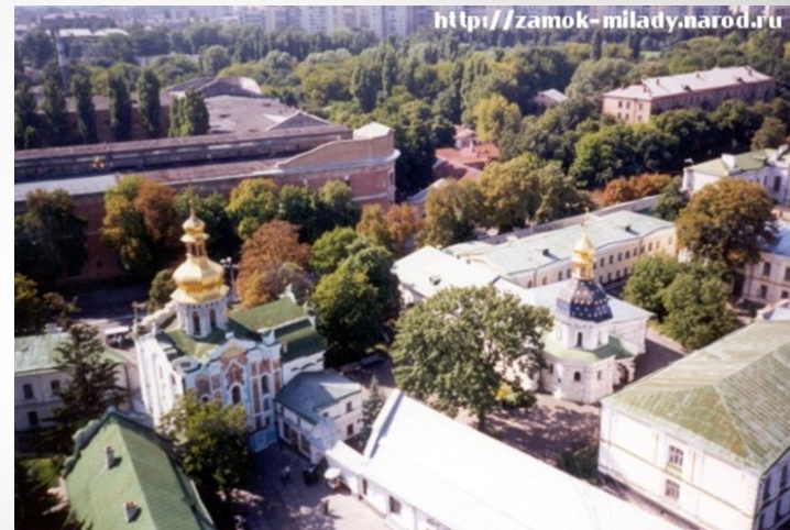
Киев – город, куда переехал писатель после смерти отца