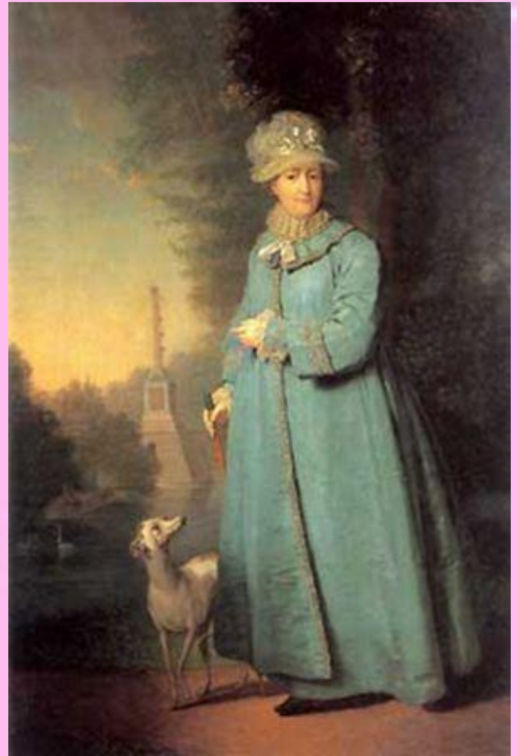
В.Боровиковский. Екатерина II.