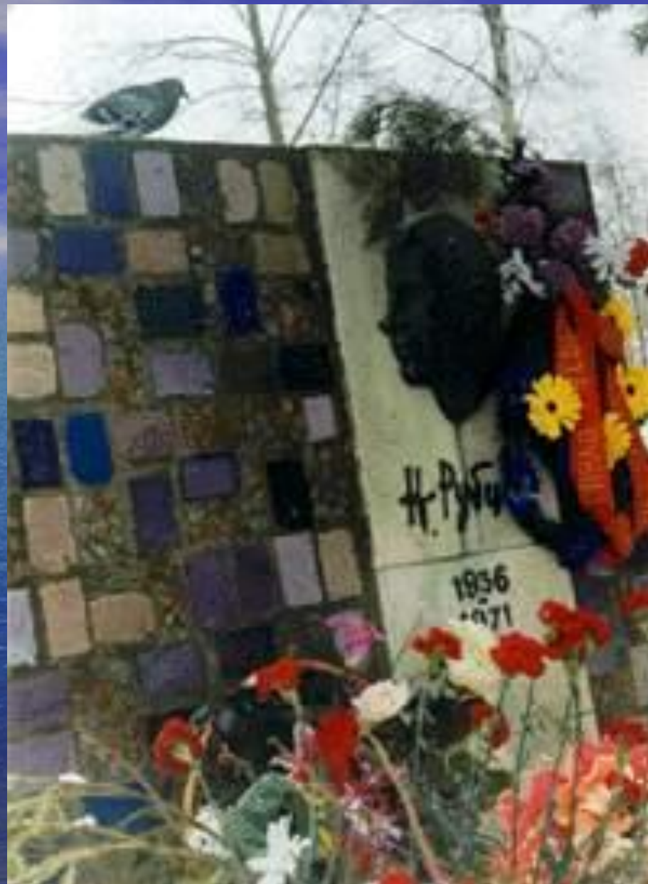
Могила Н. Рубцова