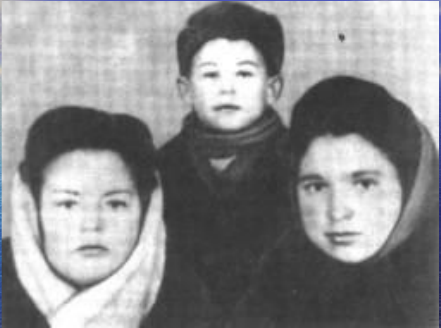
Николай Рубцов с воспитательницами детдома