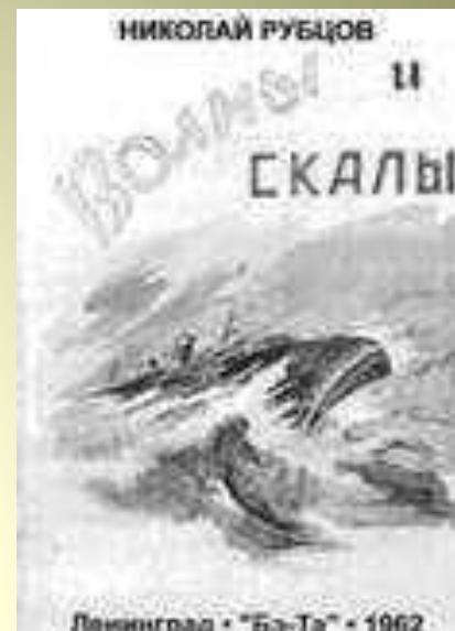
ВОЛНЫ И СКАЛЫ 1962 г.