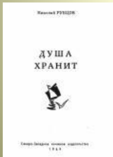
ДУША ХРАНИТ 1969 г.