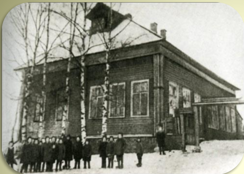
Детский дом в с.Никольское