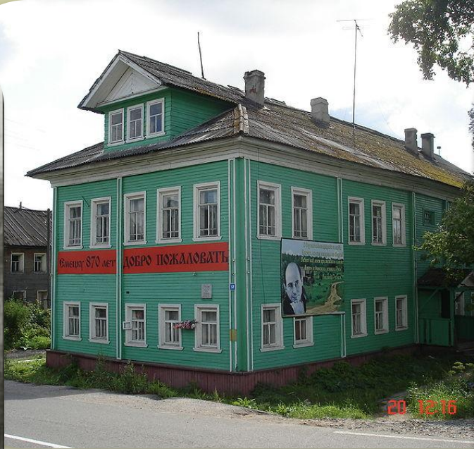
Дом, где родился Рубцов