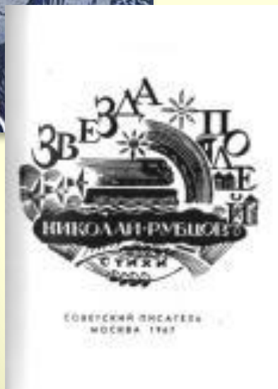
ЗВЕЗДА ПОЛЕЙ 1967 г.