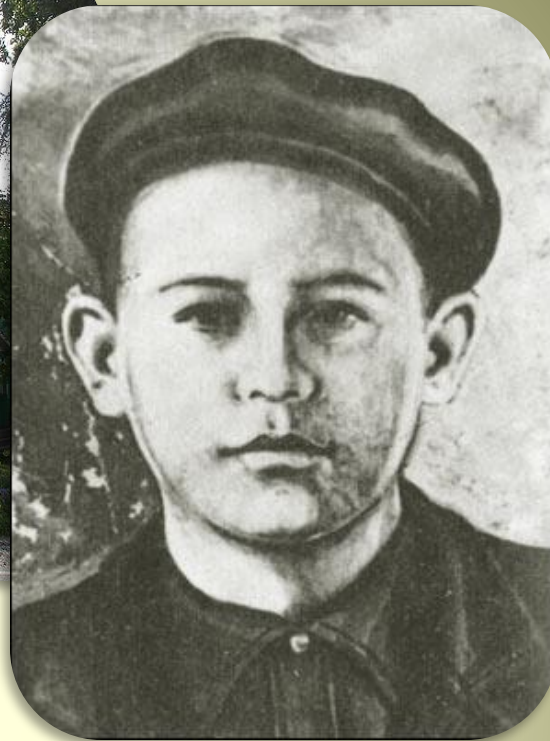
Н. Рубцов в детстве

Николай Рубцов родился 3 января 1936 года в селе Емецк Архангельской области. В 1940 году переехал вместе с семьёй в Вологду, где Рубцовых и застала война.