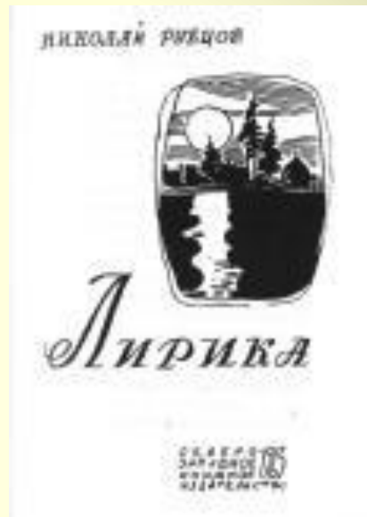
ЛИРИКА 1965 г.