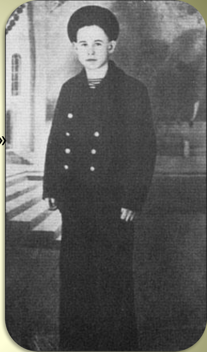
На тралфлоте – такие ребята... 1953 г.

1952г – вторая неудачная попытка стать моряком. Его желание быть ближе к морю было настолько огромно, что, в конце концов, он устроился всё-таки кочегаром на рыболовецкое судно