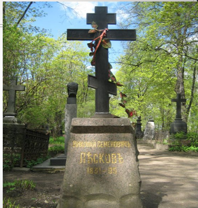
Могила Н.С.Лескова на Литераторских мостках Волкова кладбища