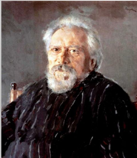
Отец, Семён Дмитриевич Лесков (1789—1848)