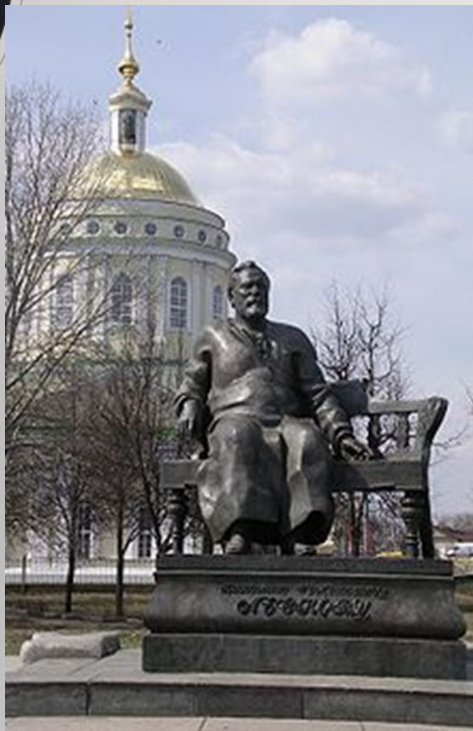
Памятник Н.С. Лескову в Орле