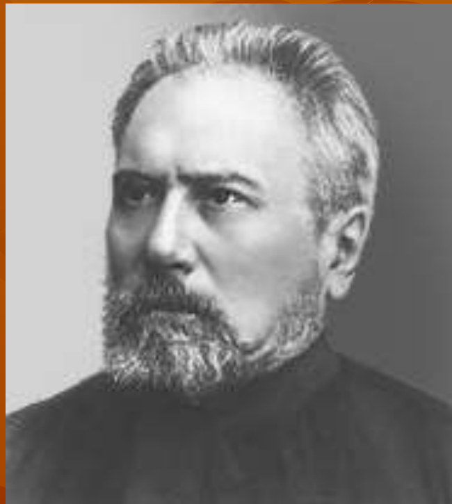
Николай Семёнович Лесков