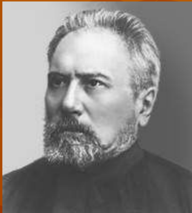
Николай Семёнович Лесков