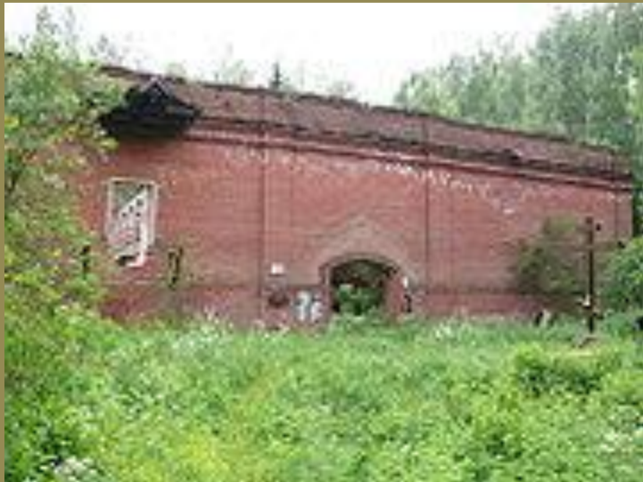
Крест-кенотаф в вероятном месте Н. С. Гумилева. о на, у изгиба реки Лубьи