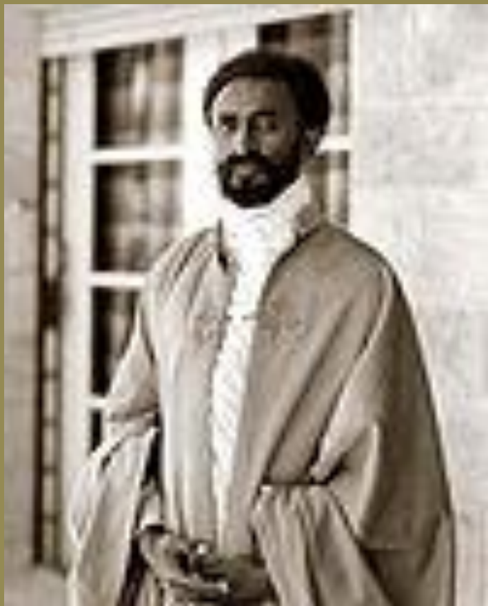
Хайле Селассие I