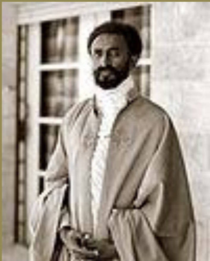
Хайле Селассие I