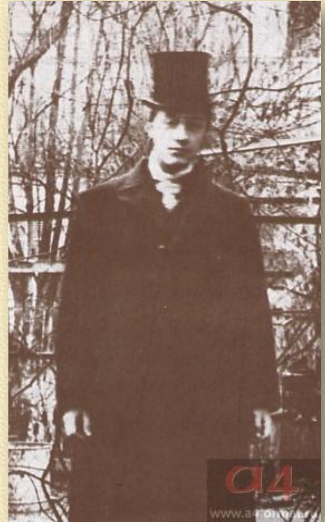
Н. Гумилёв в Париже

Николая Гумилева всегда тянуло в заморские страны , ему хотелось увидеть все, испытать новые чувства, а затем оформить свои впечатления в стихи. Он уехал в Париж , «душа требовала расстояний и впечатлений». Париж стал для Гумилева вторым домом . Сюда он приезжал очень часто, но стихи раздаривал другим городам, которые затмевали образ привычного Парижа.