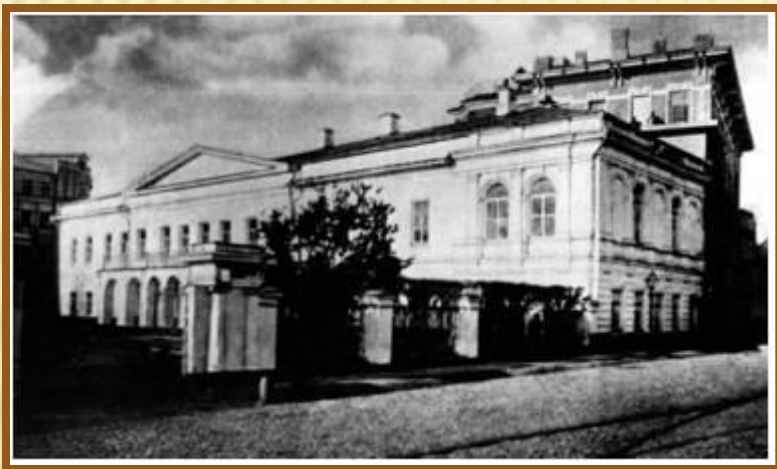
Дом на Никитском бульваре в Москве, где жил последнее время и умер Н.В.Гоголь

Неудовлетворенность взыскательного художника «положительными» образами второго тома «Мертвых душ», их нежизненностью, желание сказать миру свое «спасительное слово» побудили Гоголя выступить с публицистической книгой писем-статей «Выбранные места из переписки с друзьями» (1847).