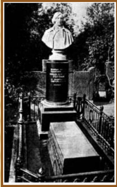
Могила Н.В. Гоголя на Новодевичьем кладбище в Москве