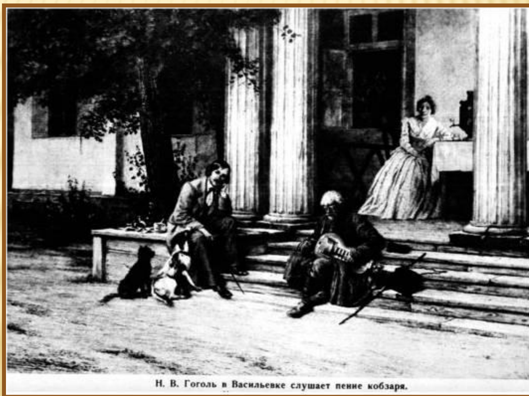
Н. В. Гоголь в Васильевке слушает пение кобзаря.

Образы народной поэзии наряду с реальными впечатлениями жизни украинского села легли в основу повестей, составивших книгу «Вечера на хуторе близ Диканьки».