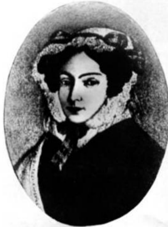
М. И. Гоголь, мать писателя. Портрет работы неизв. художника. Первая четверть XIX в.

«Нужно сильно потрясти детские чувства, и тогда они надолго сохранят все прекрасное. Я испытал это на себе».