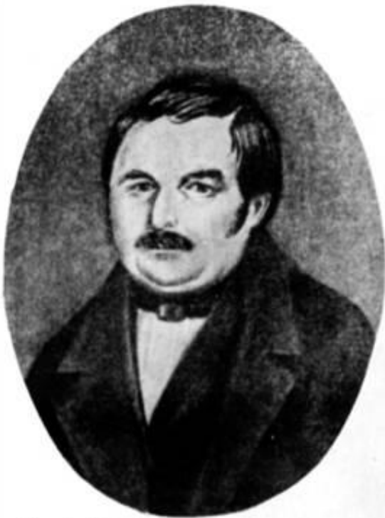
В. А. Гоголь, отец писателя. Портрет работы неизв. художника. Первая четверть XIX в.