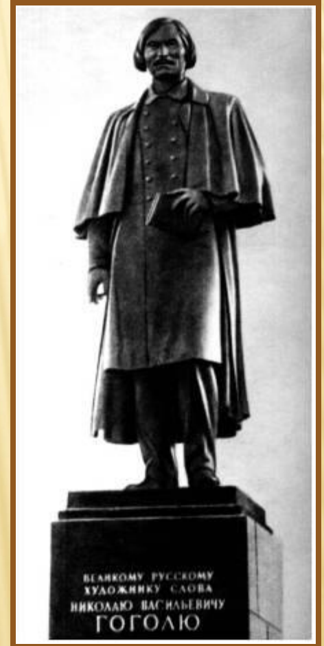
Памятник Н.В.Гоголю на Гоголевском бульваре в Москве. Скульптор Н.В.Томский