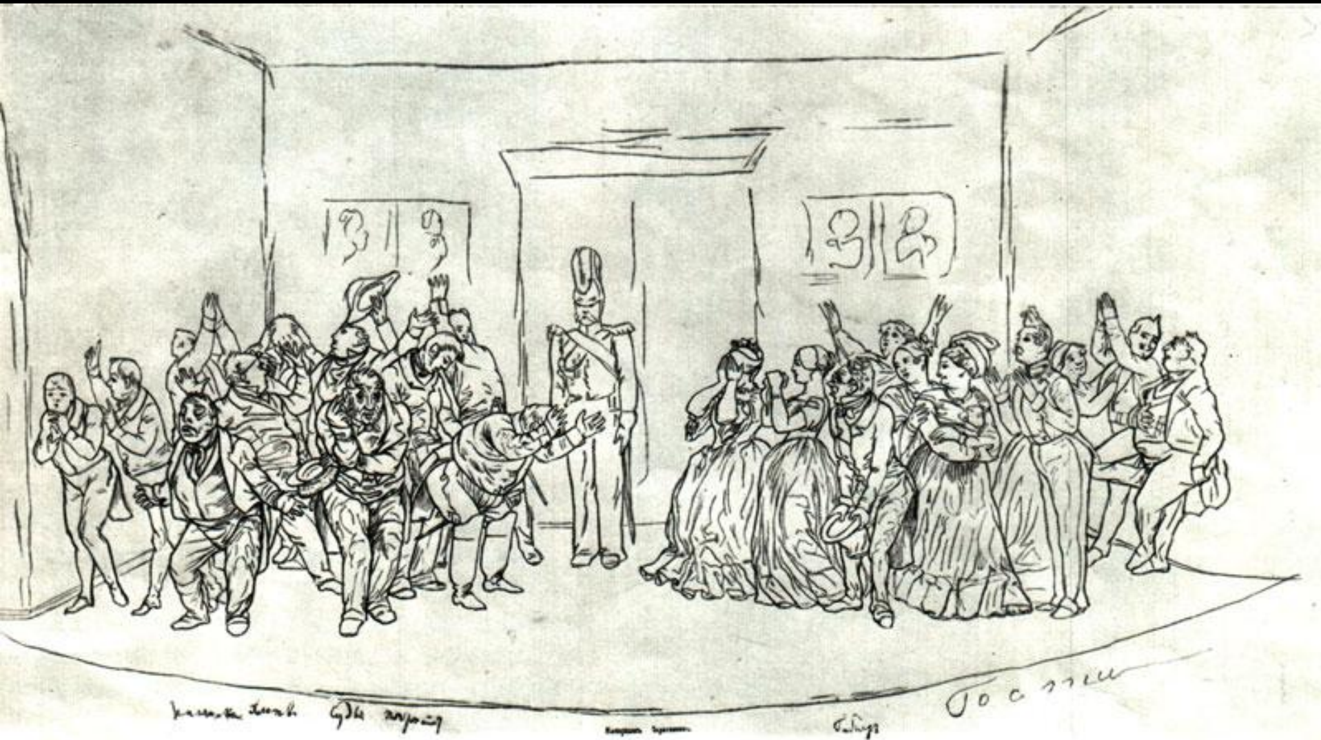
«РЕВИЗОР». ЗАКЛЮЧИТЕЛЬНАЯ СЦЕНА. Рисунок Н. В. Гоголя (?)