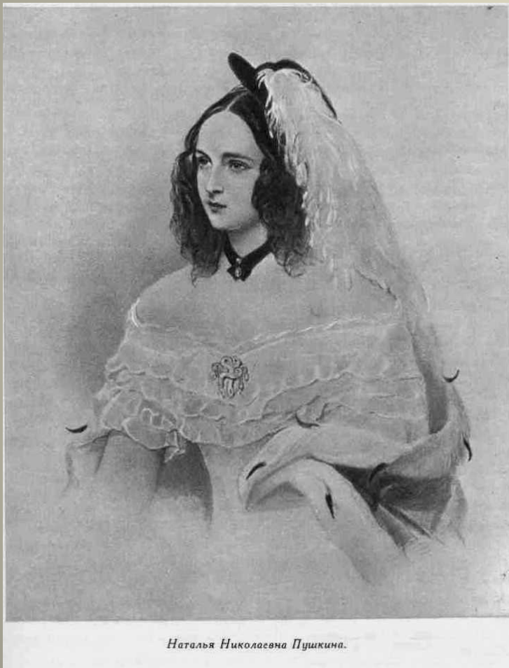
Наталья Николаевна Пушкина.