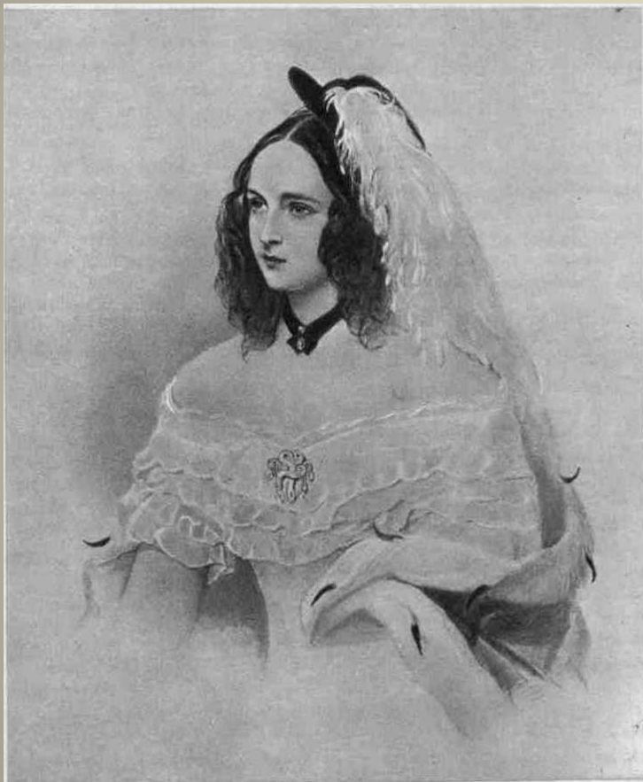
Наталья Николаевна Пушкина.