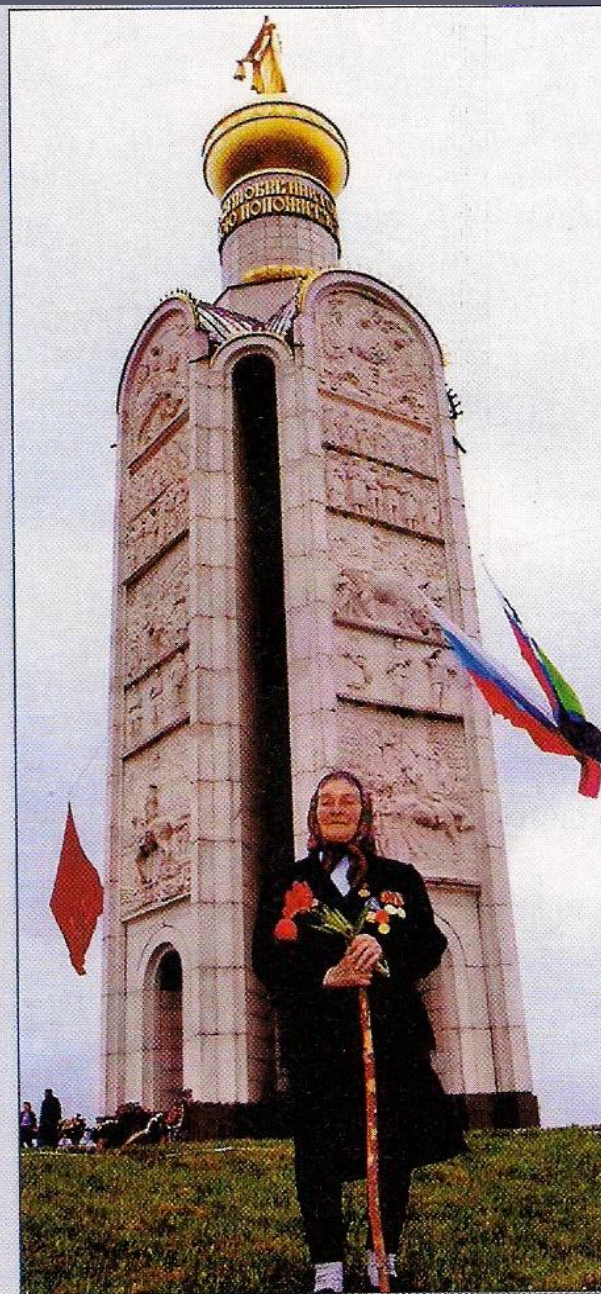
На Прохоровском поле. 2000-е гг.

Как вы понимаете заглавие рассказа? О каком и чьём исцелении идёт речь?