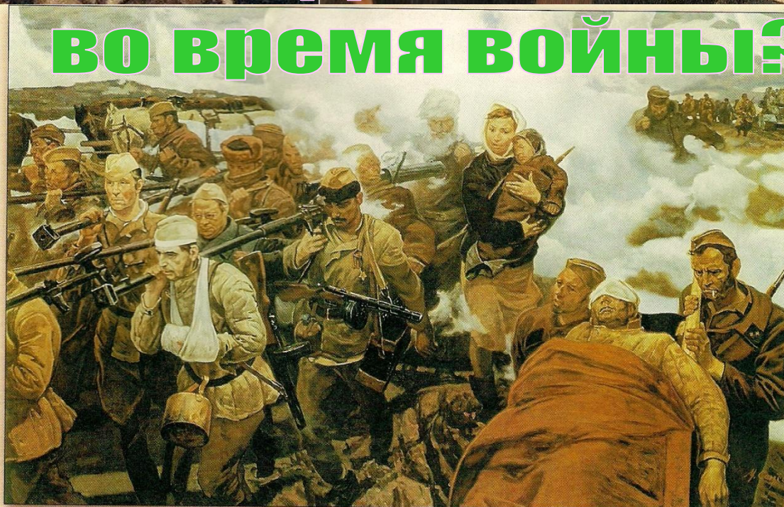
М.И.Самсонов. В боях за Отчизну. 1987