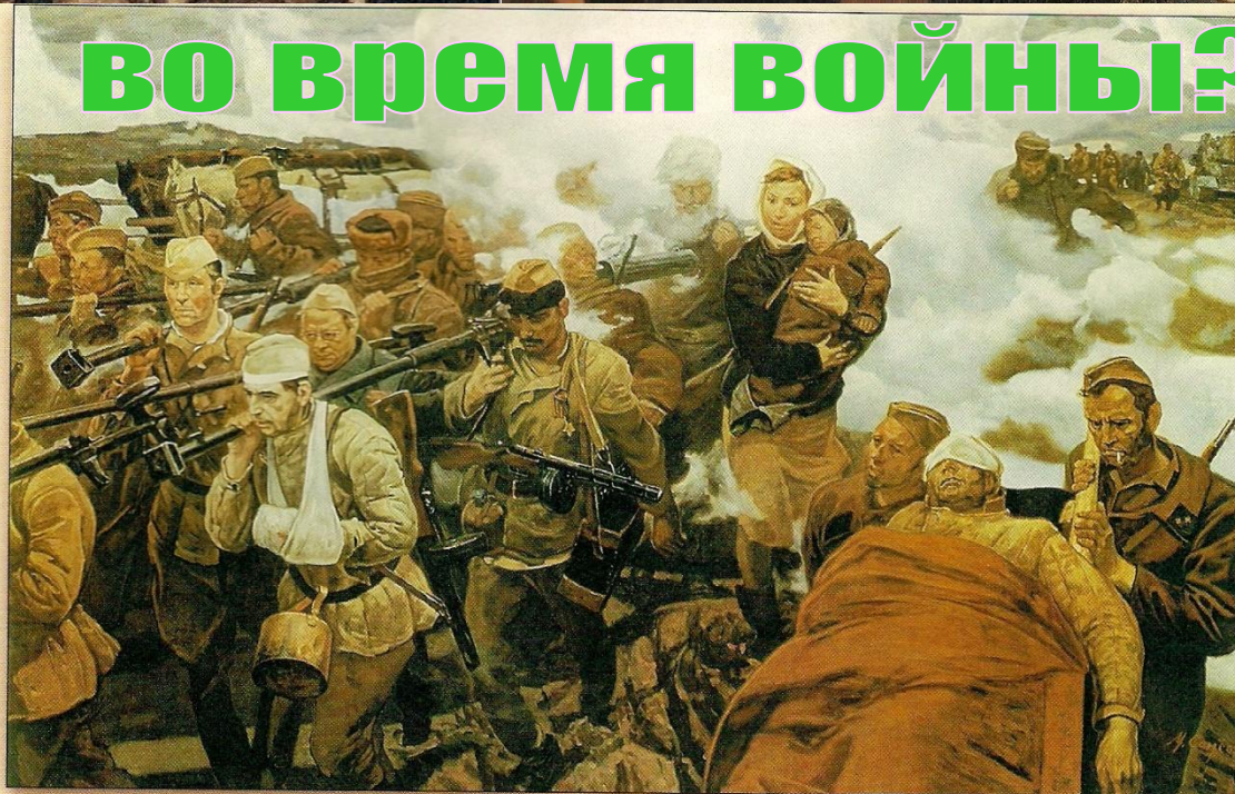
М.И.Самсонов. В боях за Отчизну. 1987