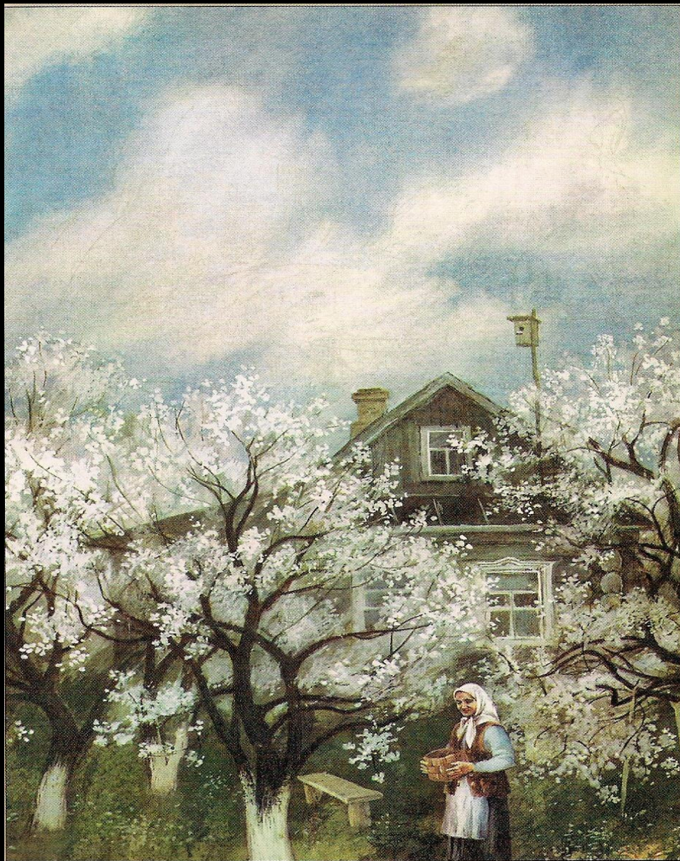
С.Бордюга. Иллюстрация к рассказу «Живое пламя»