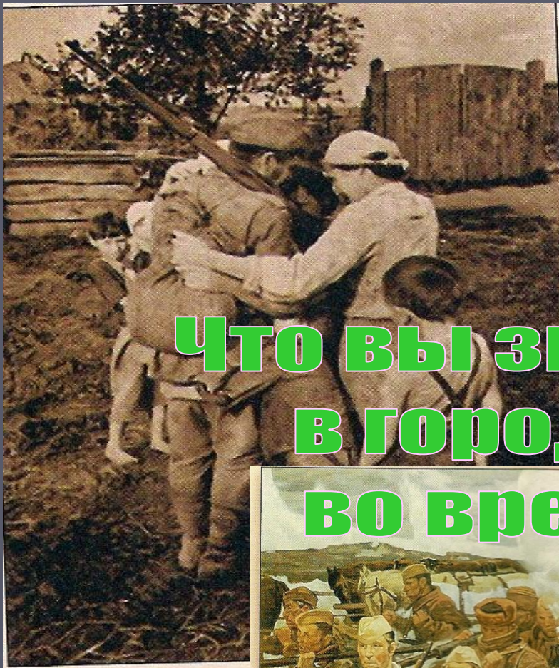
22 июня 1941 г.