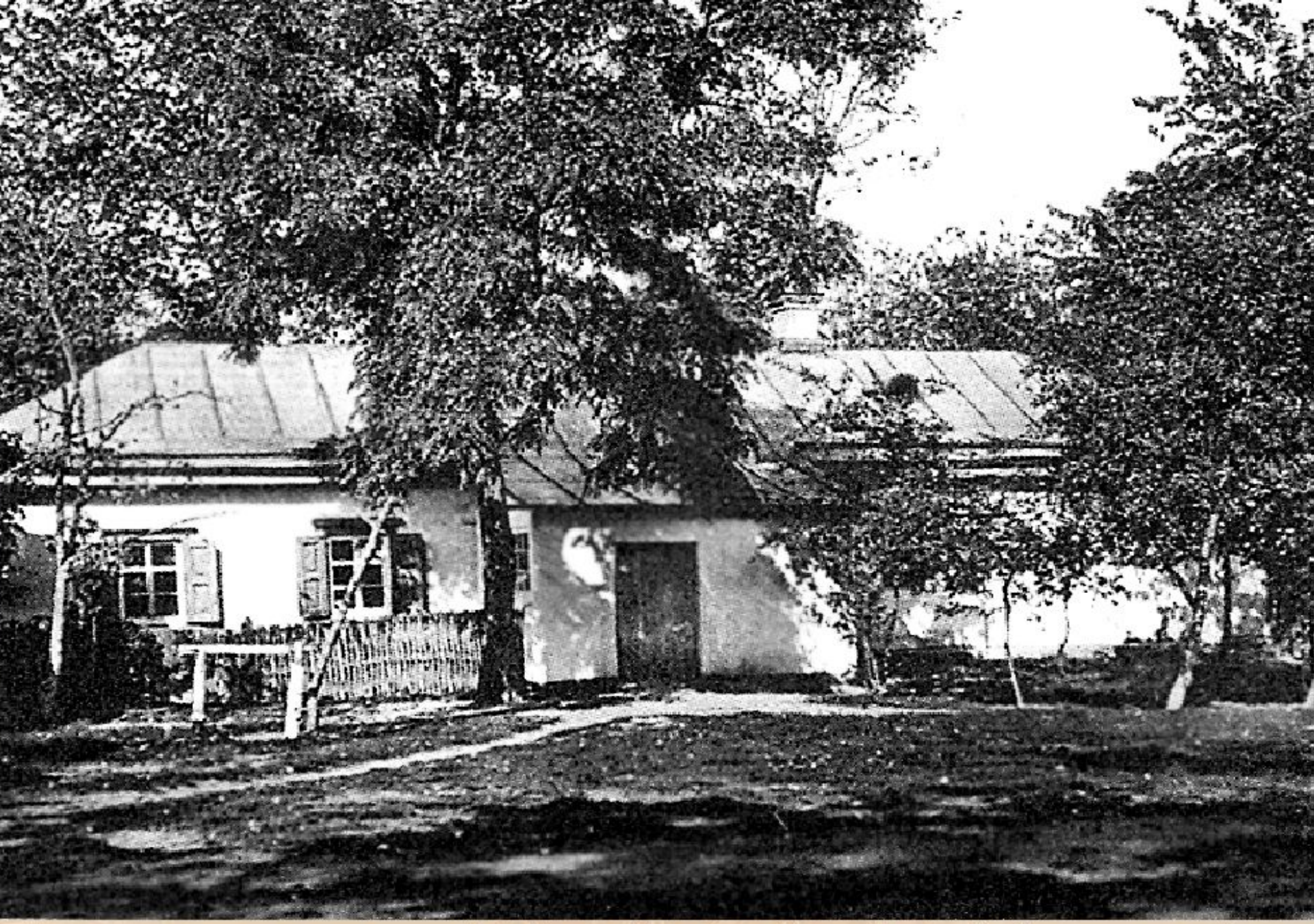
Предполагаемое место рождения Н.В. Гоголя. Флигель в бывшей усадьбе Трохимовского Великие Сорочинцы.