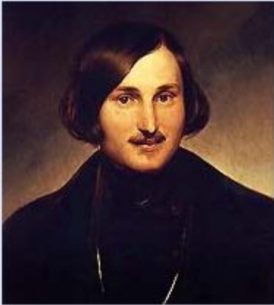
Н. В. Гоголь. Портрет работы Ф. А. Моллера. 1841 г.

Картины народной жизни, добро и зло в повести Н. В. Гоголя «Ночь перед Рождеством»