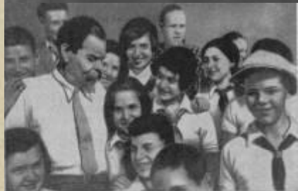
М. Горький о писателях — авторами книги «Вам курьезно». Фотография.