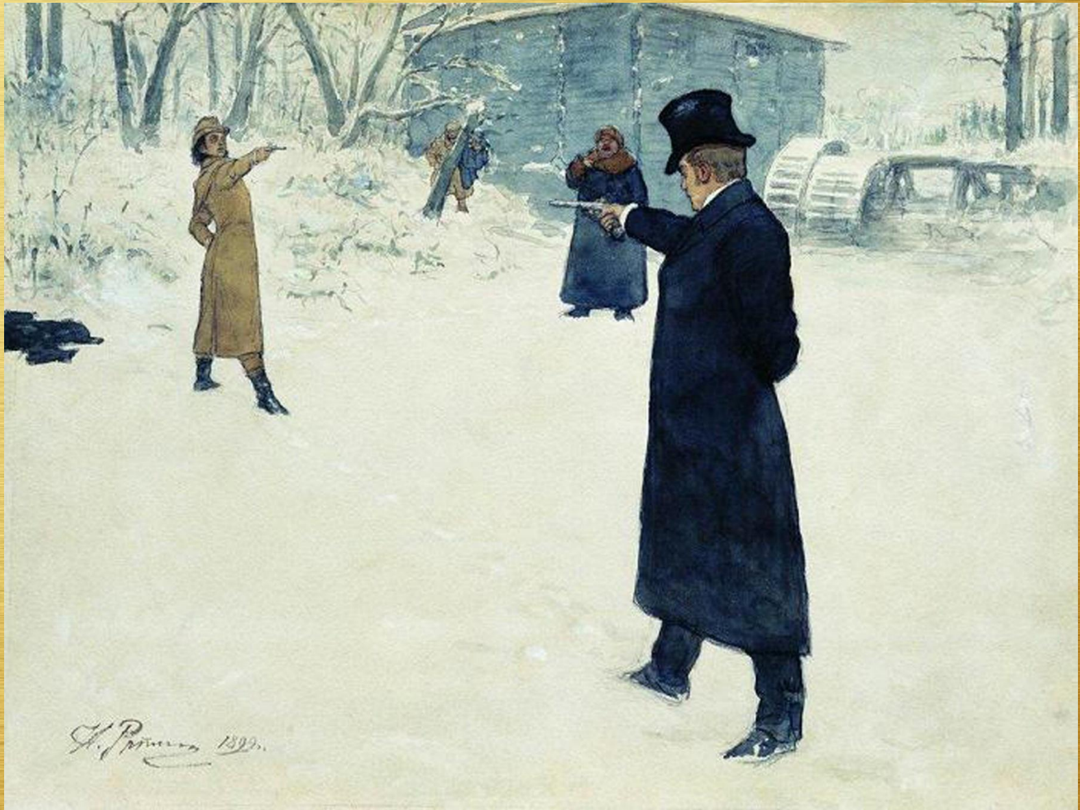
Илья Репин. Дуэль Онегина и Ленского. 1899 г.