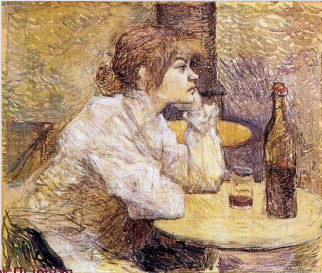
А. Тулуз-Лотрек Пьющая

Прочитайте начало рассказа. Как характеризуется героиня?