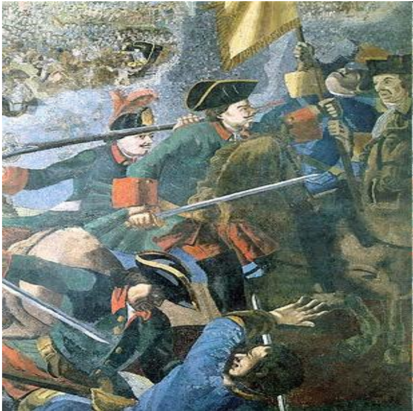
«Полтавская баталия». Фрагмент мозаики М. В. Ломоносова