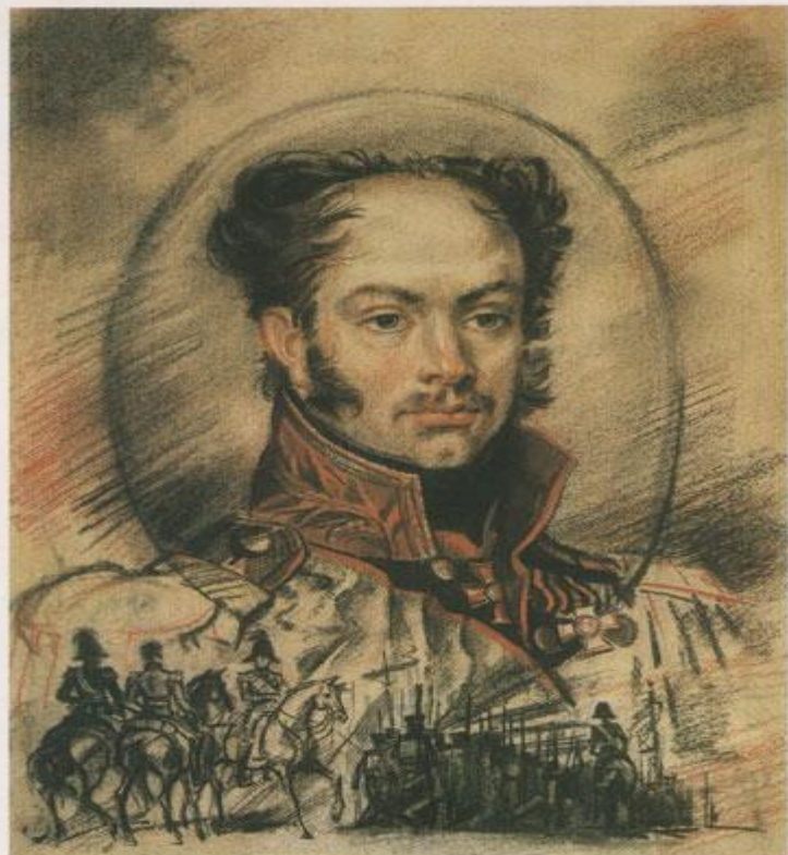
Михаил Федорович Орлов 1788—1842