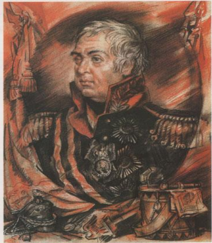
Михаил Илларионович Кутузов 1745—1813