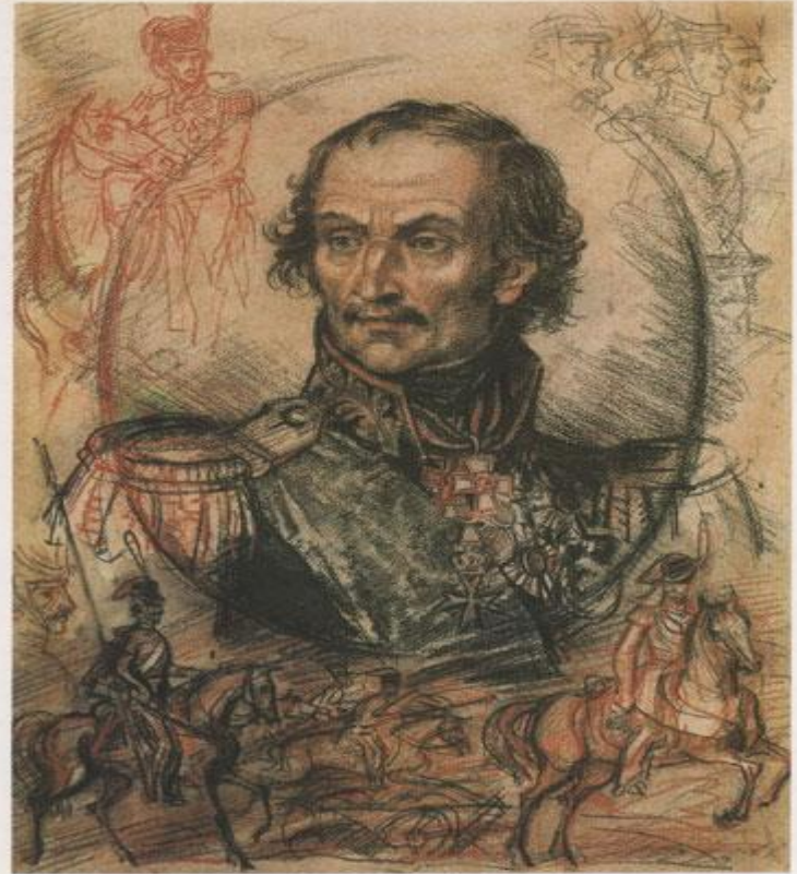
Матвей Иванович Платов 1751—1818

• Прославленный герой Отечественной войны начал службу урядником (унтер-офицером). В двадцать три года у реки Калалах одержал победу над крымскими татарами. Участвовал в бою на Кинбурнской косе и по представлению Суворова был произведен в полковники.