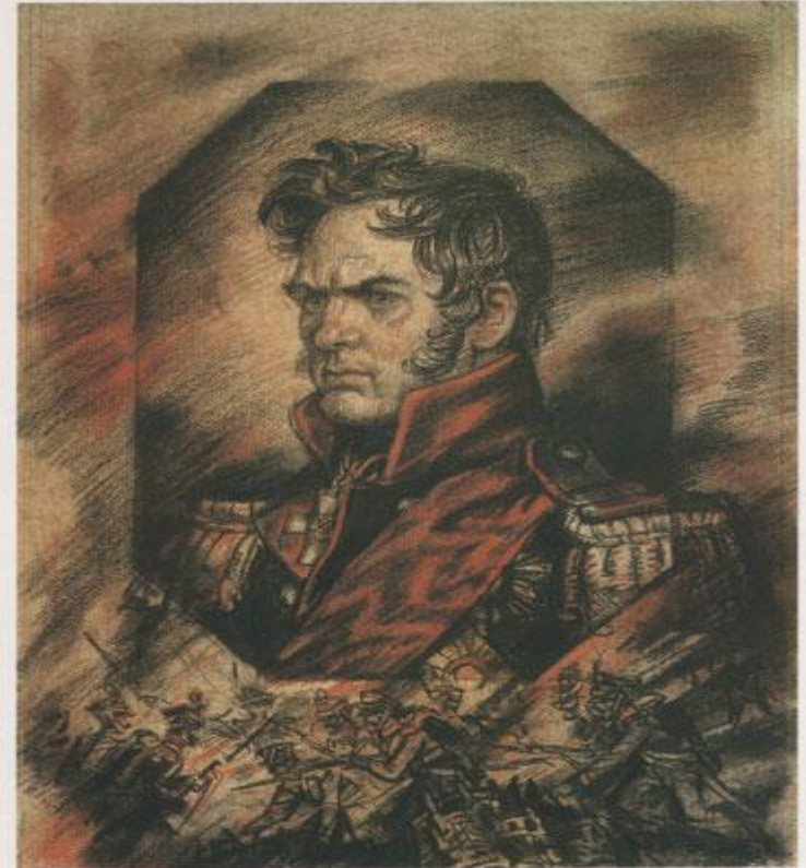
Алексей Петрович Ермолов 1777—1861

Выдающийся военный и государственный деятель А. П. Ермолов начал свой воинский путь при Суворове в 1794 году.