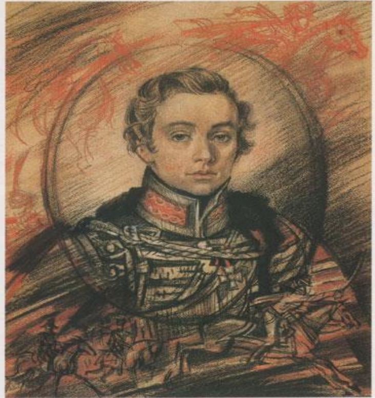
Надежда Андреевна Дурова 1783—1886

Нашествие Наполеона вызвало небывалый патриотический подъем в русском обществе. Во всенародную борьбу с захватчиками входили представители всех слоев населения. Сохранилась память и о героинях той поры.