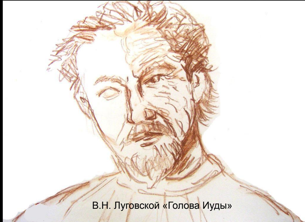
В.Н. Луговской «Голова Иуды»

Христос — воплощение добра, красоты, истины.