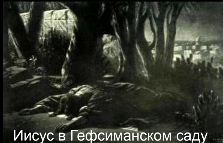
Иисус в Гефсиманском саду