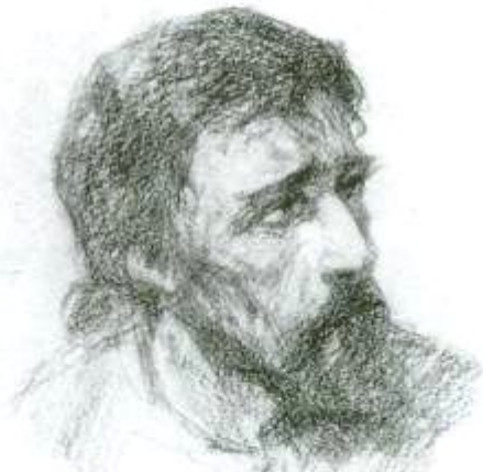
В.Д. Polenov «Голова Христа»

Христос — воплощение добра, красоты, истины.