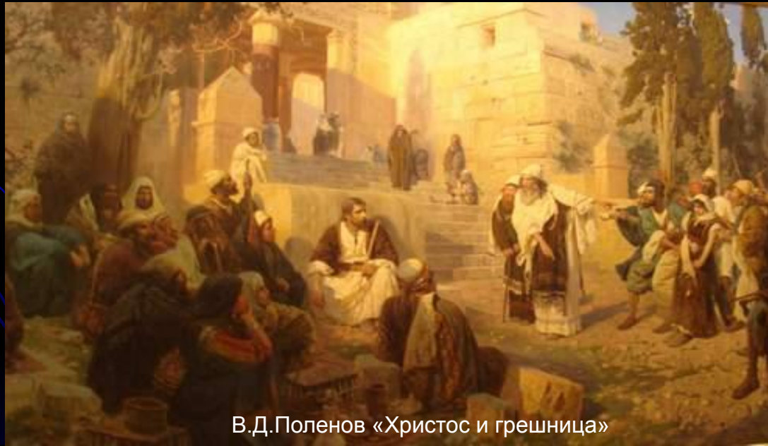
В.Д.Поленов «Христос и грешница»

Грешит из-за любви к ближнему(крадет деньги, чтобы прокормить блудницу)