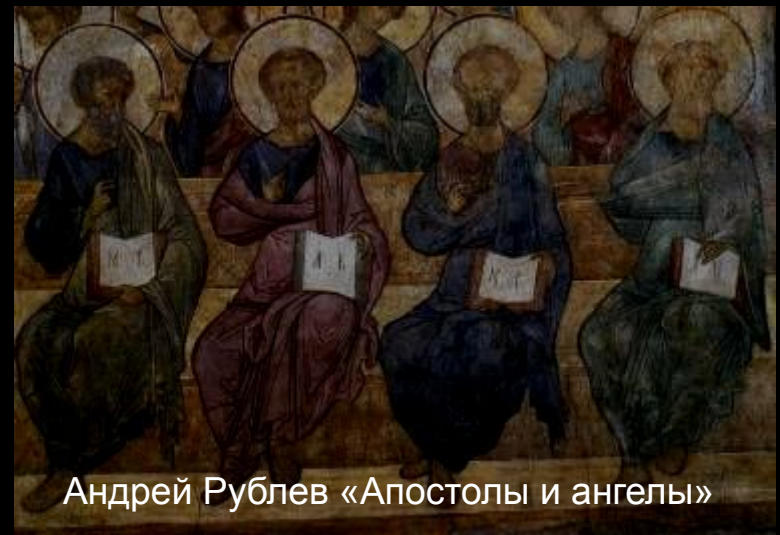
Андрей Рублев «Апостолы и ангелы»

Любят поспать, поесть Делят место возле Иисуса на небесах