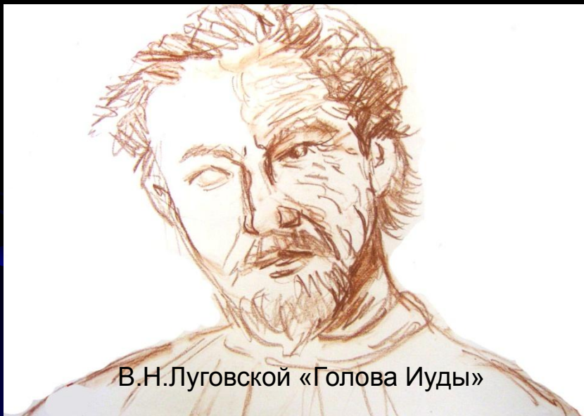
В.Н.Луговской «Голова Иуды»

Старается стать нужным Превосходит силой своей любви к Иисусу