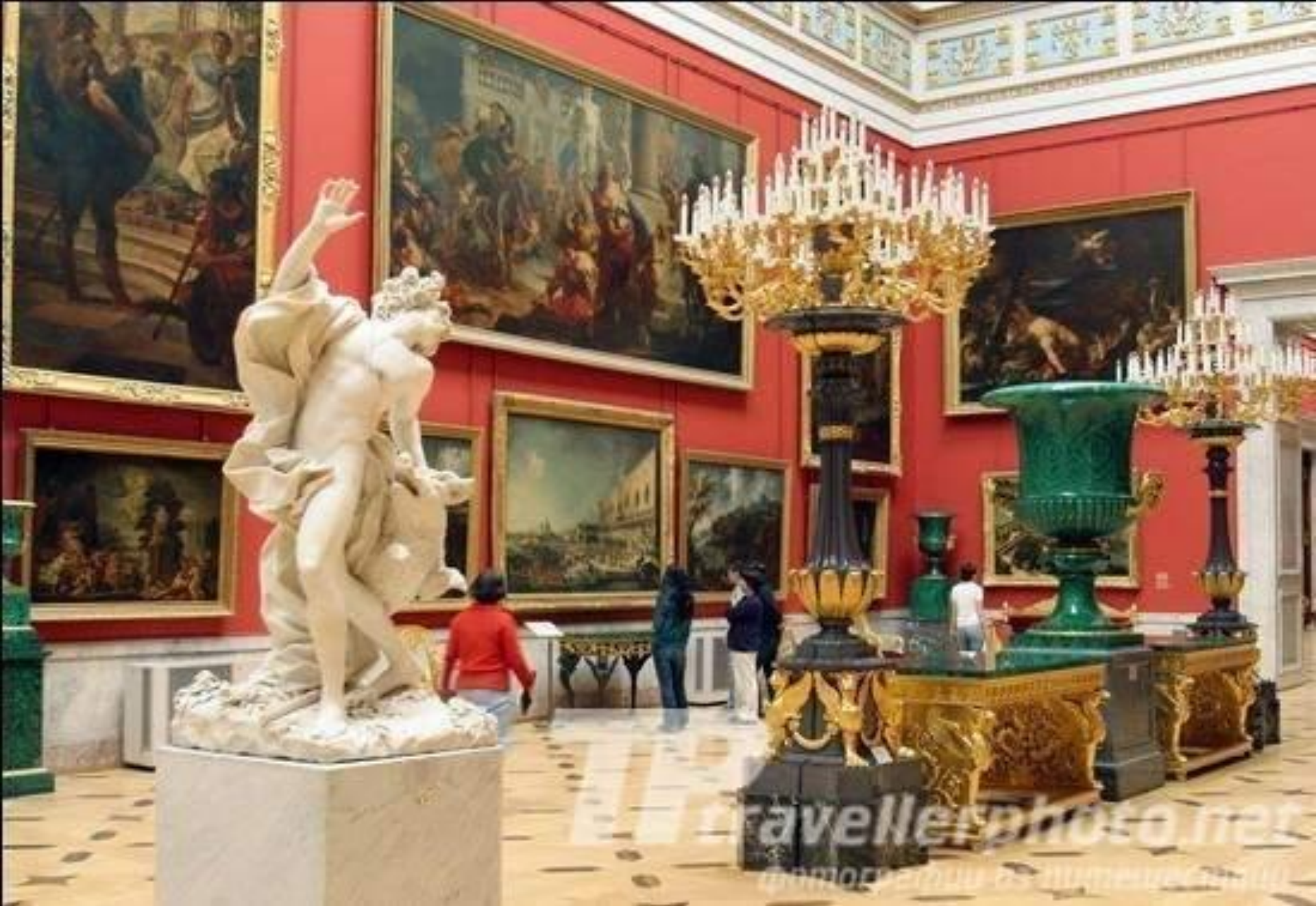
Зал итальянского искусства