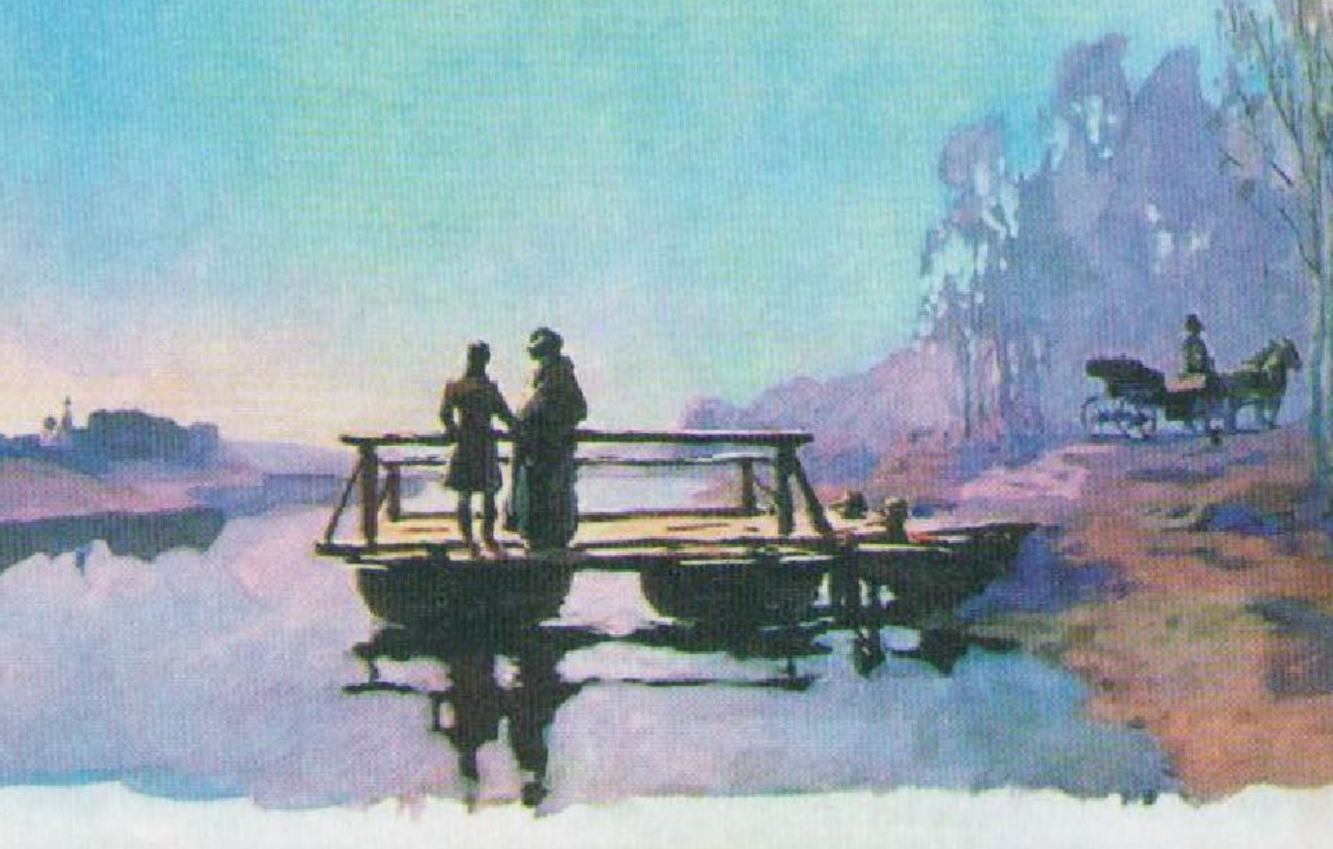
А.В. Николаев. Андрей и Пьер на пароме. 1970