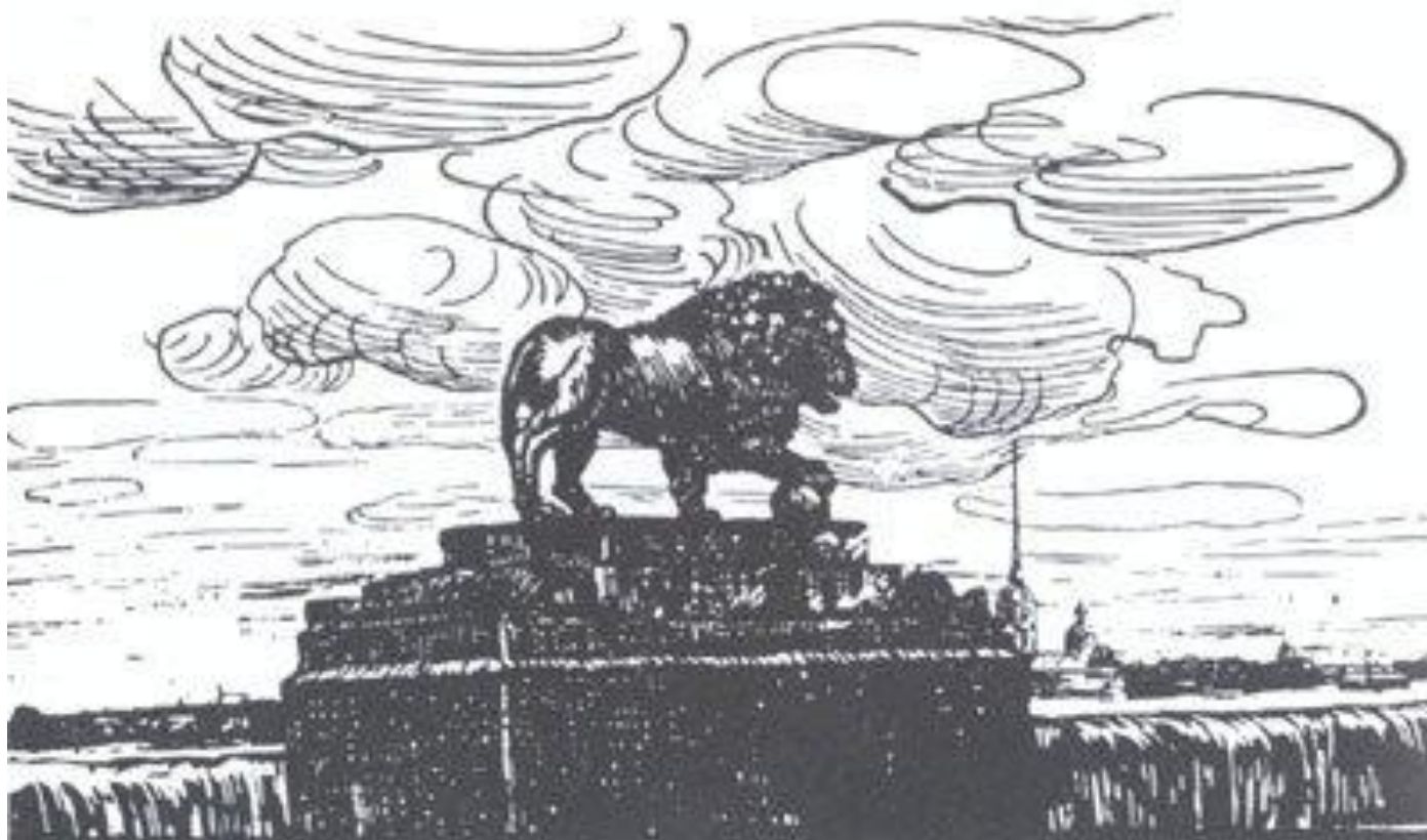
Иллюстрация к поэме «Медный всадник»