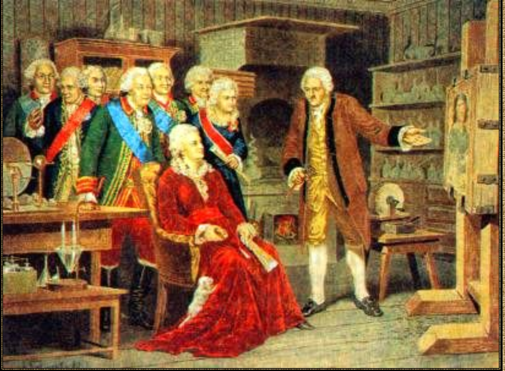
Екатерина II в кабинете М.В.Ломоносова