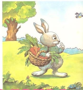
С горы увёртыш