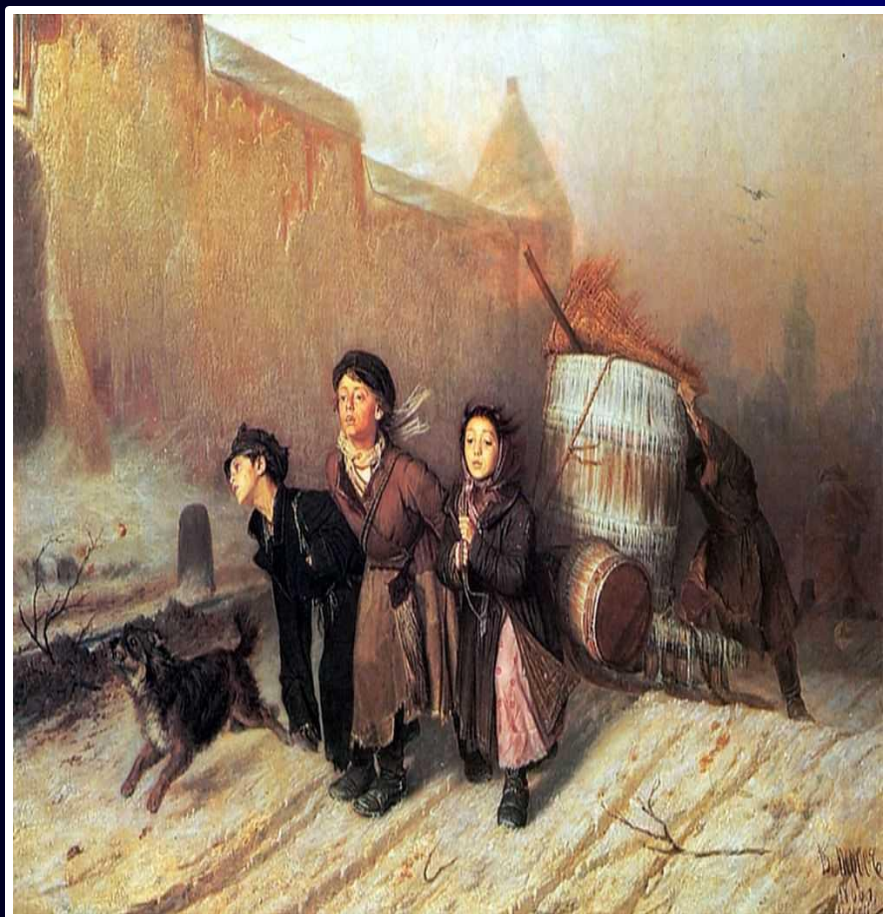
Василий Перов "Тройка"