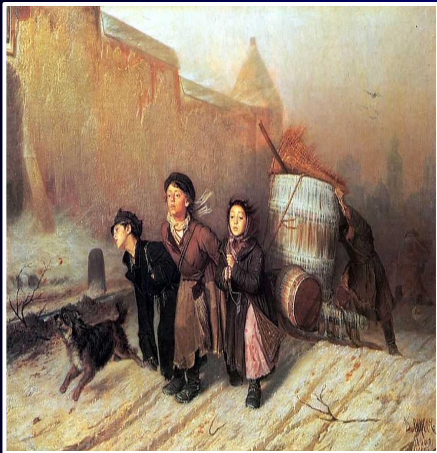
Василий Перов "Тройка"