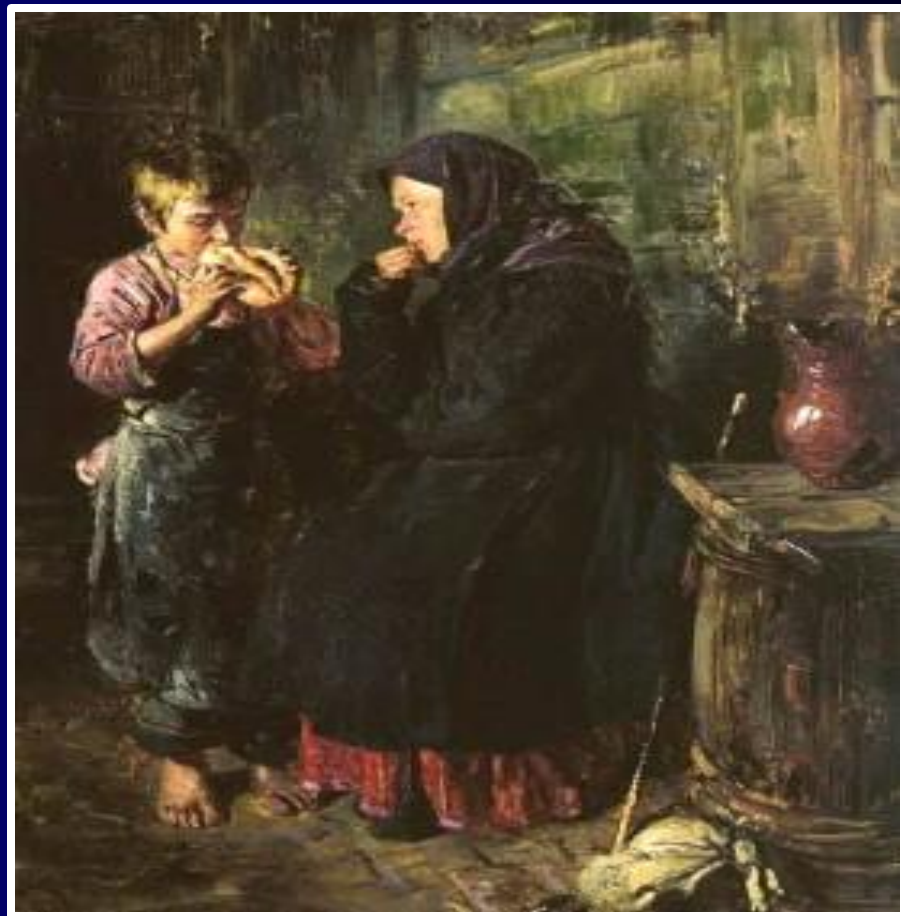
Владимир Маковский "Свидание"