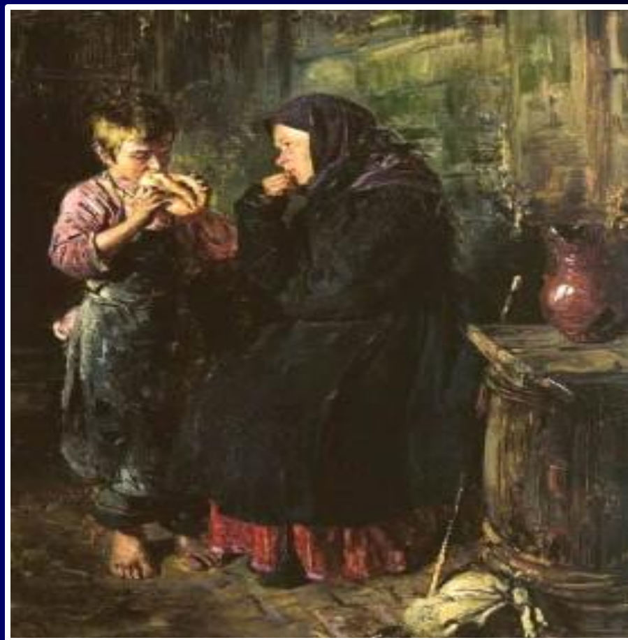
Владимир Маковский "Свидание"